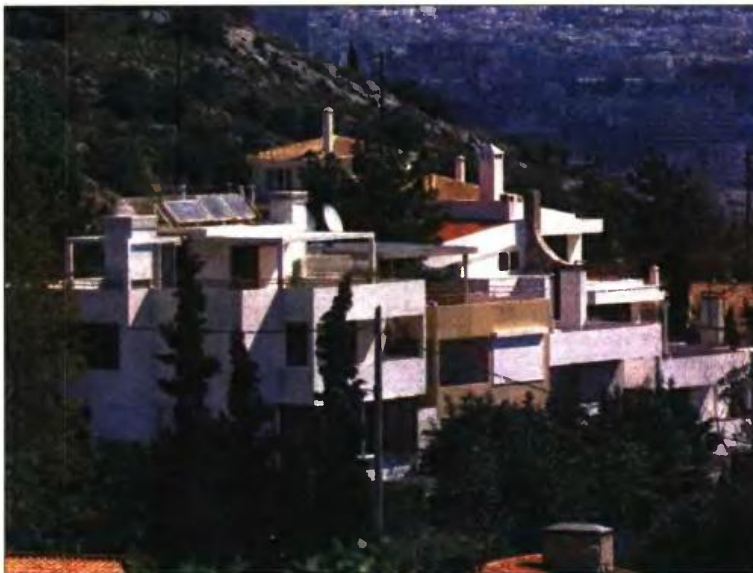
Στη νέα ρύθμιση θα προβλέπεται και το ότι θα μπορούν να αλλάξουν χρήση χώροι που έχουν νομιμοποιηθεί από προηγούμενους νόμους

Ειδικότερα, ο 4495/17 προβλέπει σήμερις έκπτωση στο πρόστιμο τακτοποίησης