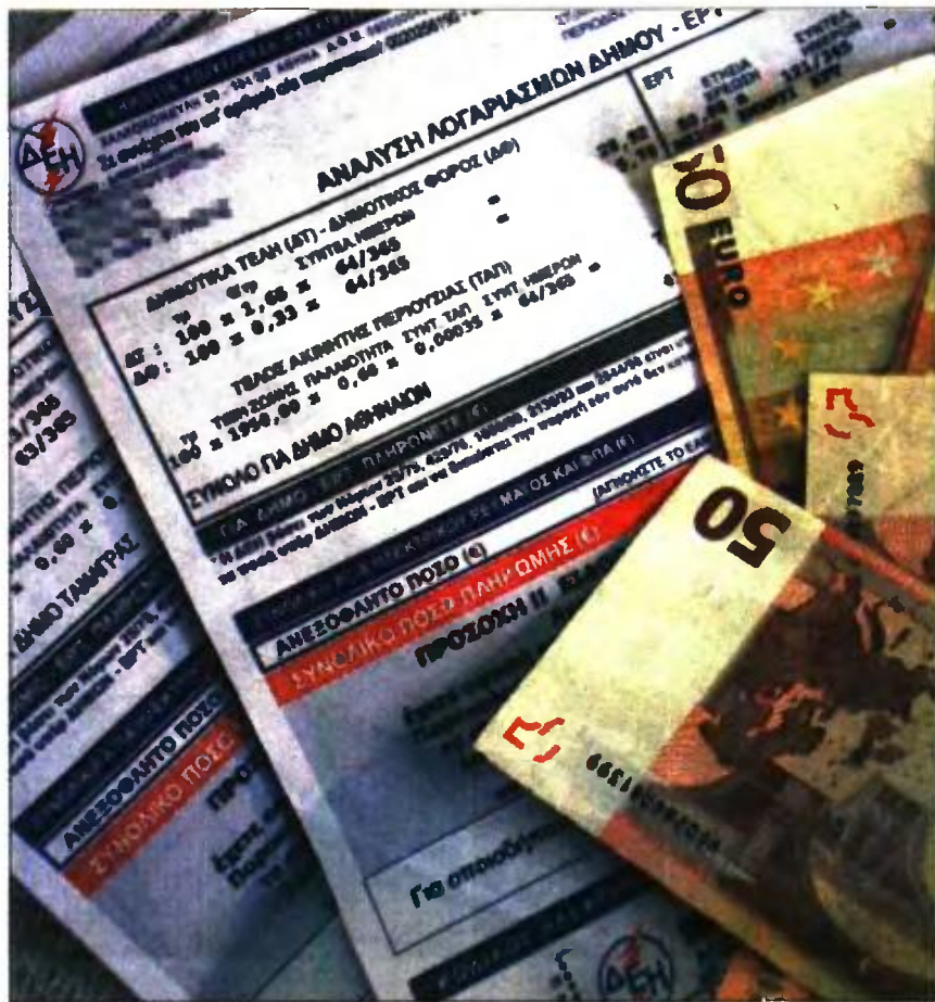
Ερχεται νέο -αυστηρότερο- Κοινωνικό Οικιακό Τιμολόγιο στη ΔΕΗ

Στην ουσία, για να μπει κάποιος στο νέο ΚΟΤ πρέπει η συνολική φορολογητέα αξία ακίνητης περιουσίας όλων των μελών του νοικοκυριού, στην Ελλάδα ή στο εξωτερικό, να μην υπερβαίνει το ποσό των 120.000 ευρώ για νοικοκυριά με ένα μέλος. Προσαυξάνεται κατά 15.000 ευρώ για κάθε πρόσθετο μέλος έως το ποσό των 180.000 ευρώ. Μάλιστα, για να πάρει κάποιος την έκπτωση του 70% που προβλέπεται για μία από τις δύο νέες κατηγορίες του ΚΟΤ πρέπει να μην έχει καταθέσεις άνω των 3.000