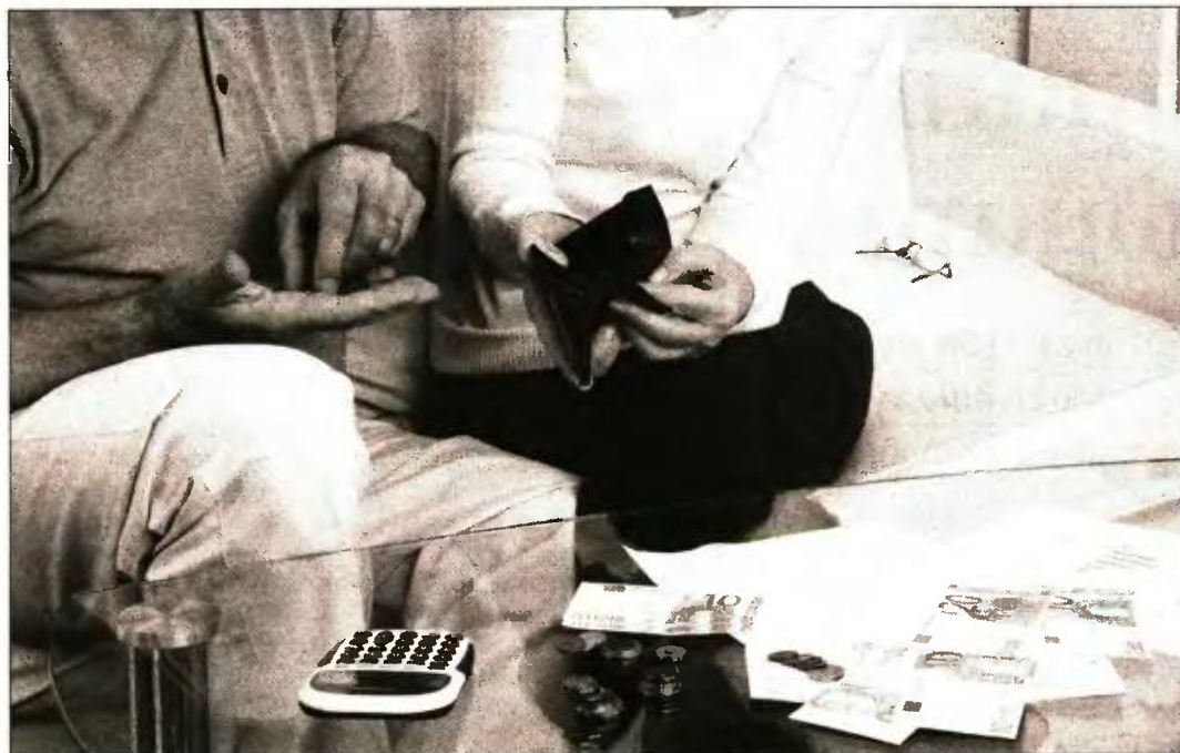
Από μία έως τρεις συντάξεις τον χρόνο θα χάσουν οι συνταξιούχοι

Ετσι, παρότι οι συνταξιούχοι θα συνεχίσουν να εισπράττουν τα ίδια ποσά έως το τέλος του τρέχοντος έτους, από 1/1/2019, όταν θα αρχίσει η καταβολή των συντάξεων με βάση το νέο σύστημα, δηλαδή το άθροισμα της εθνικής και της ανταποδοτικής σύνταξης, η προσωπική διαφορά θα είναι η πρώτη που θα «κοπεί» στον βωμό επίτευξης των δημοσιονομι-