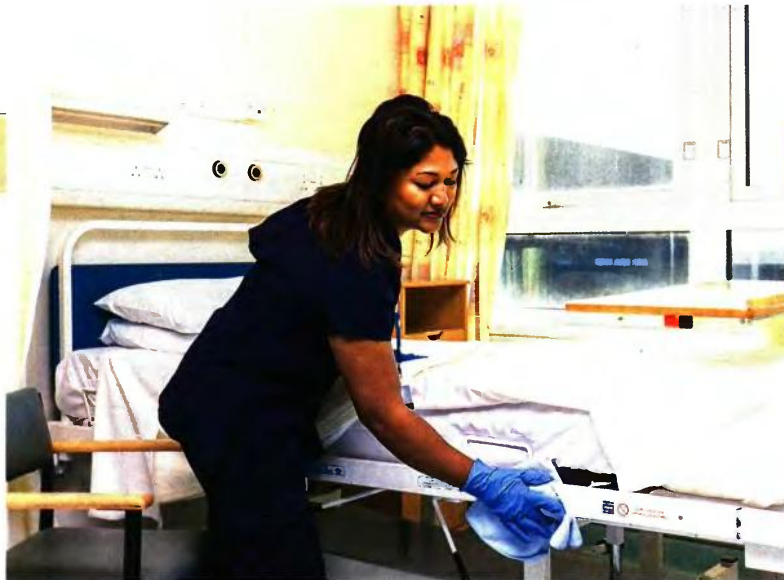
ΑΓΡΙΝΙΟ ΚΑΙ ΑΙΓΙΟ