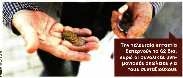
Την τελευταία επταετία ξεπερνούν τα 62 δισ. ευρώ οι συνολικές μνημονιακές απώλειες για τους συνταξιούχους

Τέλος, κατά το ΕΝΔΙΣΥ συντάξεις οι οποίες είναι πολύ χαμηλότερες από τις εισφορές που καταβάλλονται δημιουργήσε ο νόμος Κατρούγκαλου. Μάλιστα από το 2019 και μετά οι συντάξεις του δημόσιου συστήματος ασφάλισης θα είναι υποχρηματοδοτημένες.