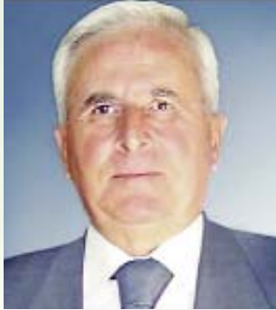
Του Βασίλη Θεοδοράκου Προέδρου της Ανωτάτης Συνομοσπονδίας Πολυτέκνων Ελλάδος (ΑΣΠΕ)