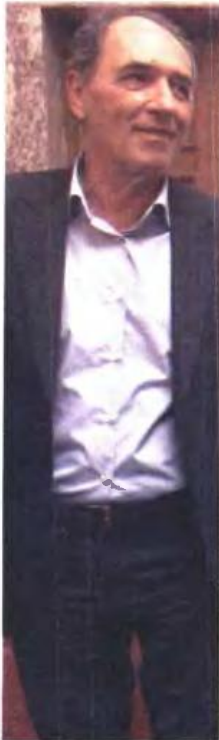
Ο υπουργός Οικονομίας Γιώργος Σταθάκης.

Μέρος των προσαποτιμίων αποτελεί η σταδιακή κατάργηση των πρόωρων συντάξεων με προοπτική πλήρους εξάλειψής τους έως το 2022 - αλλά και η μείωση της μειονεξίας στους τρεις μήνες, από τους έξι που είναι η σημερινή διάρκεια ισχύος. Εργασιακά και ασφαλιστικά καταλαμβάνουν δεσποζόουσα θέση στο 3ο μνημόνιο, καθώς μέσα στο φθινόπωρο θα πρέπει να έρθει στη Βουλή νέο νομοσχέδιο τόσο για την αλλαγή των εργασιακών δικαιωμάτων, όσο και ένα καινούργιο ασφαλιστικό, το οποίο αναμένεται να οδηγήσει σε νέες περικοπές. Κατά τη διάρκεια του 3ου μνημονίου θα υπάρξουν νέες περικοπές σε κύριες και επικουρικές συντάξεις. Ο υπουργός Οικονομίας Γιώργος Σταθάκης, μιλώντας χθες το βράδυ στον τηλεοπτικό σταθμό Mega, παραδέχτηκε ότι θα υπάρξουν πέραν της εισφοράς για την υγειονομική περίθαλψη που έχει ήδη νομοθετηθεί - περικοπές στις επικουρικές πάνω από ένα όριο (δεν το διευκρίνισε), αλλά και περικοπές στη συνταξιοδοτική δαπάνη την περίοδο 2017-2018 που θα προσεγγίσει το 1% του ΑΕΠ (δηλαδή κοντά στο 1,7 δισ. ευρώ).