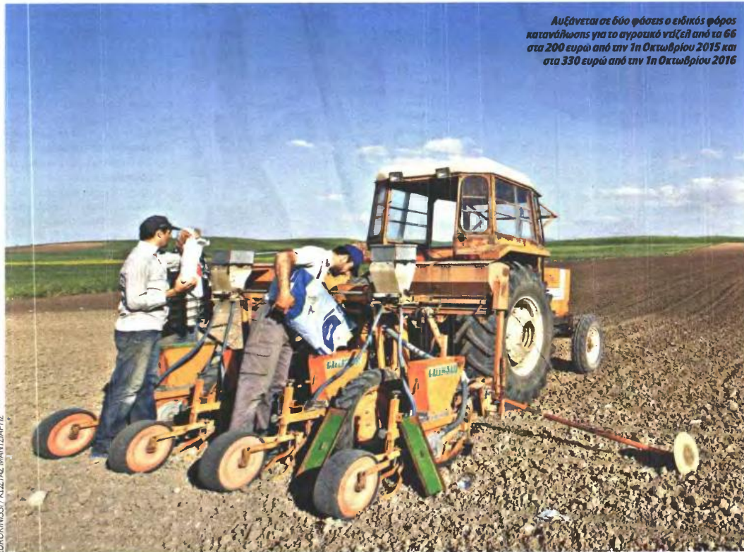
Αυξάνεται σε δύο φορές ο ειδικός φόρος κατανάλωσης για το αγροτικό ντάτζελ από τα 66 στα 200 ευρώ από την 1η Οκτωβρίου 2015 και στα 330 ευρώ από την 1η Οκτωβρίου 2016