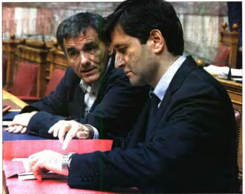
Οι Ενkleiθής Τσακαλώτος (αριστερά) και Γιώργος Χουλιαράκης

Δυσκολότερο απ' ό,τι φάνηκε αρχικά αποδεικνύεται το ζήτημα των φαρμάκων. Η κυβέρνηση καλείται να μειώσει τις τιμές των γενόσημων και των φαρμάκων εκτός πατέντας, και δεν έχει συμφωνηθεί αν θα μειωθούν και οι τιμές των σκευασμάτων με τιμή κάτω από 12 ευρώ.