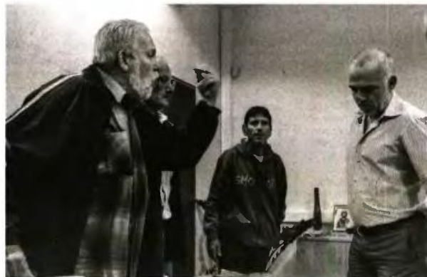
Οι οργανώσεις πήραν πανω τους το θέμα και ανέβασαν τόνους