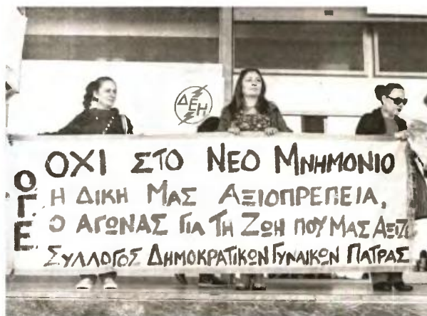
Κοινό, ανακατεμένο με μέλη συνδικαλιστικών οργανώσεων στα γραφεία της ΔΕΗ. Έγινε μίλος, αλλά η κατάσταση ελεγχθηκε

Του ΣΠΗΡΗ ΠΑΠΑΝΔΡΕΟΥ spapandreu@pelop.gr