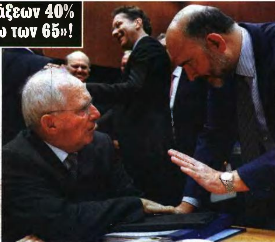
Ο Β. Σόμπλε (αριστερά) με τον Π. Μοσκοβισί σε παλαιότερο στιγμιότυπο

Τις πληροφορίες για την πρόταση μείωσης των συντάξεων με ηλικιακά κριτήρια επιχειρήσε να διαψεύσει χθες ο γενικός γραμματέας Κοινωνικών Ασφαλίσεων Νίκος Φράγκος. Όμως, πηγές που γνωρίζουν τα πράγματα έλεγαν ότι πίσω από το σχέδιο αυτό βρίσκεται η προσπάθεια του υπουργού Εργασίας Γιώργου Κατρούγκαλου να υπολογίσει