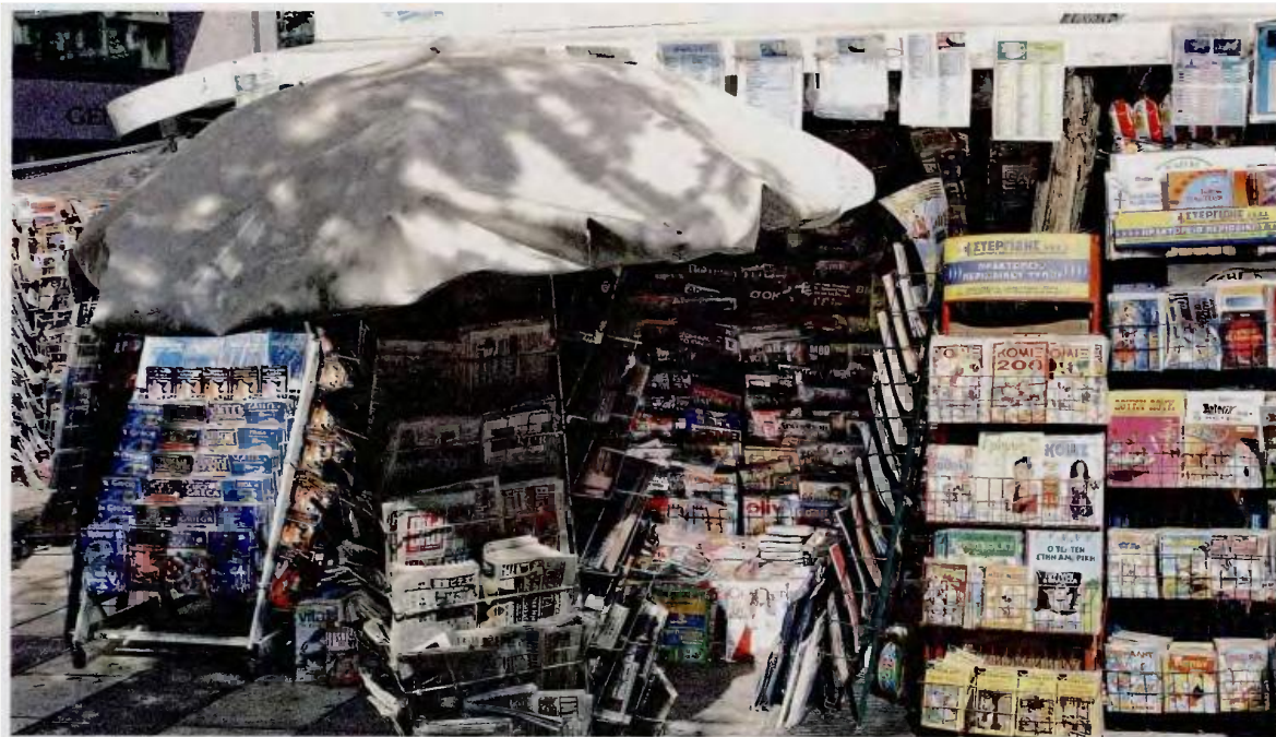
«Σύζυγος ή ενήλικα τέκνα που καθίστανται κληρονόμοι των ανωτέρω προσώπων κατά το διάστημα αυτό υπεισέρχονται αυτοδίκαια στο ανωτέρω δικαίωμα, εφόσον δηλώσουν την επιθυμία τους στην αρμόδια αρχή», προβλέπεται στο επίμαχο νομοσχέδιο.