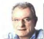
γράφει ο ΚΩΣΤΑΣ ΧΑΡΑΒΕΛΛΑΣ

Σε καθημερινή βάση τα δικαστήρια εκδίδουν αποφάσεις που δικαιώνουν οφειλέτες ασφαλιστικών ταμείων, δανειολήπτες, πρώην συμβασιούχους και χιλιάδες άλλους συμπολίτες μας που έχουν υποστεί τις συνέπειες της κρίσης