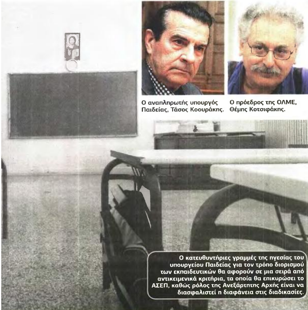
Ο αναπληρωτής υπουργός Παιδείας, Τάσος Κουζουμάκης.