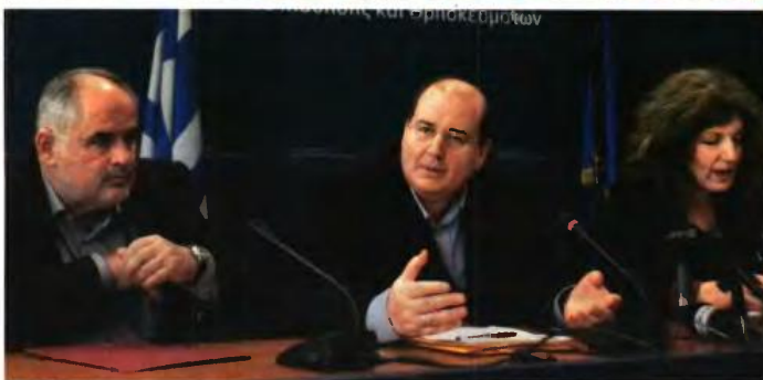
Ο ΥΠΟΥΡΓΟΣ ΠΑΙΔΕΙΑΣ Νίκος Φίλης, με την αναπληρώτρια υπουργό Παιδείας Σία Αναγνωστοπούλου και τον αναπληρωτή υπουργό Παιδείας Κώστα Φωτάκη, κατά τη διάρκεια συνέντευξη Τύπου στο υπουργείο Παιδείας για τις αλλαγές στην Παιδεία και το νέο σύστημα Πανελλαδικών Εξετάσεων εισαγωγής στα ΑΕΙ και ΤΕΙ