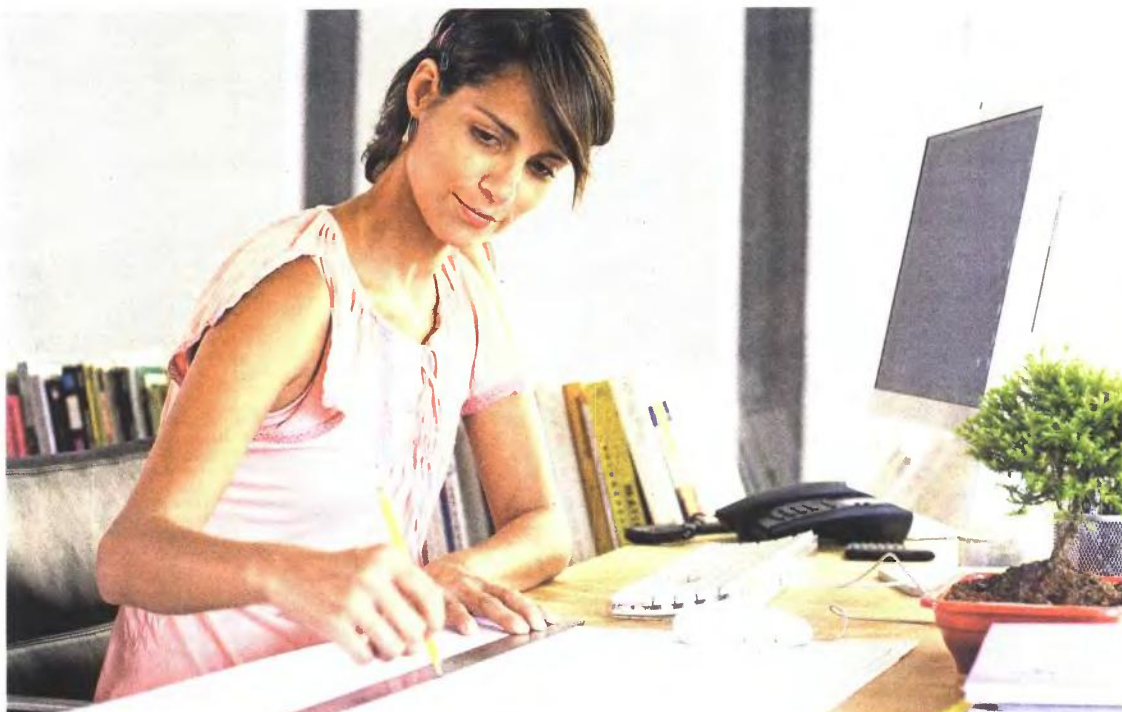
Μητέρες στα Ταμεία των ΔΕΚΟ και των Τραπεζών με συμπληρωμένα 25 έτη το 2010 και ανήλικο τέκνο μπορούν να αποχωρήσουν αν είναι 50 ετών

Εκτός κινδύνου είναι οι μητέρες αναπήρων τέκνων, καθώς με βάση το ελληνικό σχέδιο δεν απειλούνται από τις ανατροπές στις προϋποθέσεις συνταξιοδότησης.