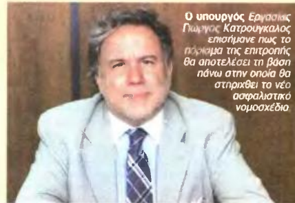
Ο υπουργός Εργασίας Γιώργος Κατρούγκαλος επισήμανε πως το πορίσμα της επιτροπής θα αποτελέσει τη βάση πάνω στην οποία θα στηριχθεί το νέο ασφαλιστικό νομοσχέδιο.

και επικουρικές συντάξεις από το 2010 και μετά (ο.ο.: έτσι ικανοποιείται και η ανάγκη να εξυπηρεθεί το ισόδημο ζήτημα του ότι οι περικοπές έχουν κριθεί αντισυνταγματικές από το ΣτΕ). Φυσικά, το ποσό που θα προκύψει για την καταβολή των υφιστάμενων συντάξεων θα πρέπει να είναι τέτοιο ώστε να καλύπτει τις μηνιασικές απαιτήσεις. Σήμερα, με δεδομένες τις περικοπές που έχουν γίνει, η συνταξιοδοτική δαπάνη διαμορφώνεται περίπου στα 27 δισεκατομμύρια ευρώ. Με βάση τον προϋπολογισμό του 2016, θα πρέπει να γίνει πρόσθετη περικοπή ώστε να εξασφαλιστεί μείωση της συνταξιοδοτικής δαπάνης τόσο του Δημοσίου όσο και των οργανισμών κοινωνικής ασφάλισης τουλάχιστον κατά 710 εκατ. ευρώ.