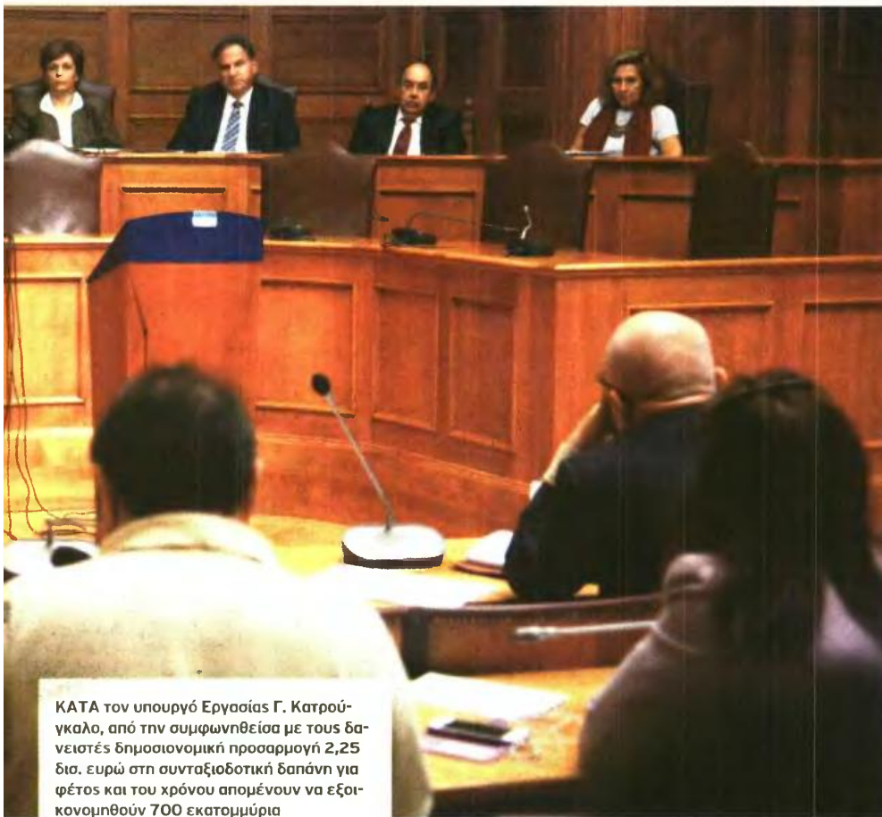
ΚΑΤΑ τον υπουργό Εργασίας Γ. Κατρούγκαλο, από την συμφωνηθείσα με τους δανειστές δημοσιονομική προσαρμογή 2,25 δισ. ευρώ στη συνταξιοδοτική δαπάνη για φέτος και του χρόνου απομένουν να εξοικονομηθούν 700 εκατομμύρια