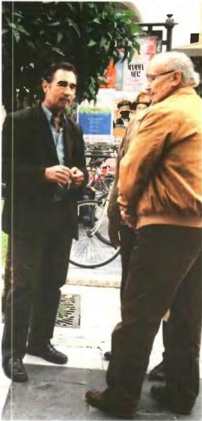
ΜΟΤΙΦΟΤΕΛΑΜ / ΘΑΝΗ ΤΡΥΦΑΝΗ

ασφάλισης και εφάπαξ μέσω μιας ενοποιημένης διαδικασίας γ) ανάθεση στο ΙΚΑ-ΕΤΑΜ/ΚΕΑΟ της βεβαίωσης και είσπραξης των ασφαλιστικών εισφορών.