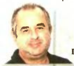
ΤΟΥ ΗΛΙΑ ΓΕΩΡΓΙΑΚΗ

Ε πανολογισμό με περικοπές των καταβλλόμενων συντάξεων - στη βάση των νέων ενιαίων κανόνων που θα καθιερώσει το νέο Ασφαλιστικό - σχεδιάζει το υπουργείο Εργασίας. Οι περικοπές τόσο στους ήδη συνταξιούχους άνω των 1.000 ευρώ όσο και στους μελλοντικούς συνταξιούχους θεωρούνται πλέον δεδομένες μετά τη χθεσινή δημοσιοποίηση του περιόρισματος της επιτροπής σοφών και τις σχετικές δηλώσεις του υπουργού Εργασίας Γιώργου Κατρούγκαλου, ο οποίος τάχθηκε υπέρ των ενιαίων κανόνων αναπλήρωσης και εισφορών, επιβεβαιώνοντας ότι τα χαμηλότερα εισοδήματα θα έχουν μεγαλύτερη αναπλήρωση της σύνταξης, ενώ για τα υψηλότερα εισοδήματα οι απώλειες θα είναι μεγαλύτερες. «Αν κάποιος έπαιρνε 1.000 ευρώ σύνταξη, θα έχει το ίδιο ποσοστό αναπλήρωσης είτε ήταν εργαζόμενος πριν