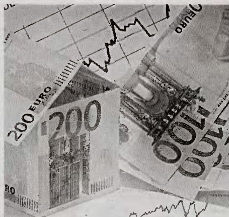
Η νέα υπηρεσιακή κυβέρνηση ετοιμάζει ένα πακέτο ολοκληρωμένων προτάσεων για τον ΕΝΦΙΑ

Μείωση του αφορολόγητου ορίου του συμπληρωματικού φόρου που σήμερα είναι 300.000 ευρώ αντικειμενική αξία με παράλληλη αύξηση των συντελεστών. Το εύρος αυτών των αλλαγών θα καθοριστεί και από την αναπροσαρ-