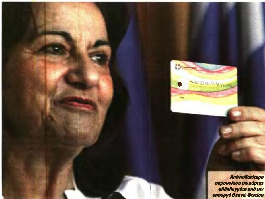
Από παλαιότερη παρουσίαση της κάρτας αλληλεγγύης από την υπουργό Θεανώ Ουτίου

Από αναμονή σε αναμονή πάει η καταβολή του οικογενειακού επιδόματος του ΟΓΑ, αν και το υπουργείο Εργασίας είχε διαβεβαιώσει ότι θα είχαν εκταμιευθεί μέχρι τις 23 Οκτωβρίου ● Καθυστέρηση και στην επιδότηση σίτισης στις κάρτες αλληλεγγύης, καρφιά από την αντιπολίτευση