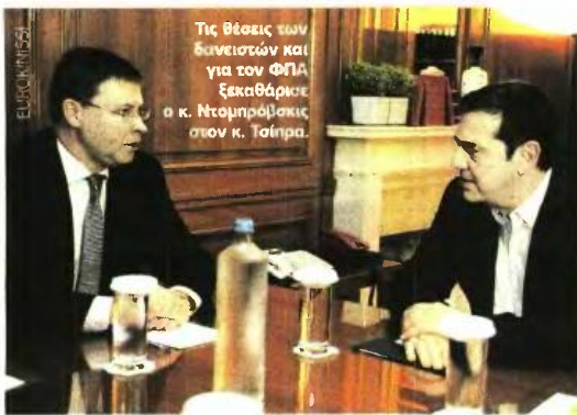
Τις θέσεις των δανειστών και για τον ΦΠΑ ξεκαθάρισε ο κ. Ντομπαρόβσκι στον κ. Τσίπρα.

ΥΠΟΧΡΕΩΜΕΝΗ να εφαρμόζει ΦΠΑ 23% στις υπηρεσίες ιδιωτικής εκπαίδευσης είναι η κυβέρνηση της... Αριστεράς, η οποία υποσχόταν τόσο κατά την προεκλογική περίοδο όσο και μέχρι πριν από λίγες μέρες ότι το επαχθές αυτό μέτρο θα καταργηθεί και θα αντικατασταθεί με άλλα «ισοδύναμα» που δεν θα θίγουν τα λαϊκά στρώματα. Η υπόσχεση της κυβερνητικής εκπροσώπου, Ολγας Γεροβασίλη, για νέα παράταση της αναστολής του μέτρου, έστω και αναδρομικά από τις 17-10-2015, δεν υλοποιήθηκε καν. Το τελεσίγραφο των δανειστών, ότι δεν είναι δυνατό να εφαρμοστούν κλιμακωτοί συντελεστές ΦΠΑ στην ιδιωτική εκπαίδευση παρά μόνο ένας συντελεστής 23% και πως μόνο η επαναφορά της πλήρους απαλλαγής των υπηρεσιών εκπαίδευσης από τον ΦΠΑ μπορεί να γίνει αποδεκτή, εφόσον όμως βρεθούν επαρκή «ισοδύναμα» μέτρα ύψους 400 εκατ. ευρώ, προσγείωσε ανώμαλα την κυβέρνηση. Τη σαφή αυτή θέση των δανειστών την επανέλαβε χθες με τον πλέον εμφαντικό τρόπο ο αντιπρόεδρος της Κομισιόν, Βάλντις Ντομπαρόβσκις, κατά τις συναντήσεις του τόσο με τον πρωθυπουργό, Αλέξη Τσίπρα, στο Μέγαρο Μαξίμου όσο και με