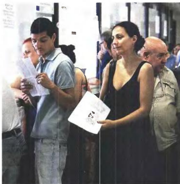
Το ποσό των δόσεων μπορεί από Οκτώβριο ή Νοέμβριο τελικά να διπλασιαστεί όχι μόνο επειδή λιγότευει ο αριθμός των δόσεων (π.χ. 50 αντί 100), αλλά και γιατί θα ισχύσει νέο καθεστώς και για τα επιτόκια που επιβαρύνουν τα ανεξόφλητα χρέη στο Δημόσιο

Αν είχε μικρότερο εισόδημα (π.χ. 20.000 ευρώ), πιθανότατα να μην επιλεγεί για αναδι-