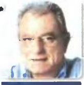
γράφει ο ΚΩΣΤΑΣ ΚΑΡΔΑΒΕΛΛΑΣ