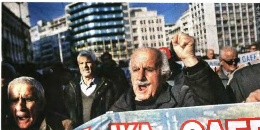
Μειώσεις δύο ταχυτήτων. Μεγαλύτερες για όσους αποχώρησαν με το παλιό μισθολόγιο και μικρότερες για όσους αποχώρησαν με το νέο.

Η απόφαση θα ισχύσει από τον Φεβρουάριο, καθώς τα όρια άντλησης χρημάτων από άλλες πηγές έχουν εδώ και καιρό εξαντληθεί. Οι περικοπές δεν είναι οριζόντιες αλλά ανάλογες των ετών πληρωμής εισφορών και των αποδοκών βάσει των οποίων υπολογίστηκαν τα αρχικά ποσά.