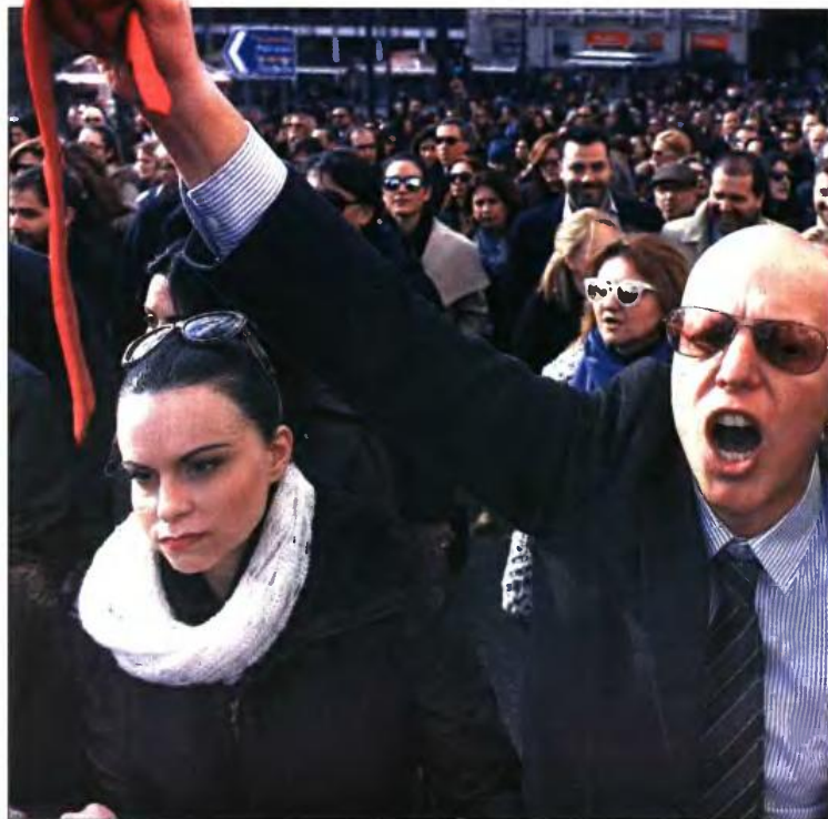
Χιλιάδες επαγγελματίες έδωσαν δυναμικό «παρών» στη μεγάλη πορεία χθες κατά του νέου Ασφαλιστικού

Οι δικηγόροι και άλλοι επαγγελματίες ξεσηκώθηκαν, πάντως, και σε άλλες περιοχές της χώρας. Ενδεικτικά, μέλη των Δικηγορικών Συλλόγων Πάτρας και Σπάρτης προέβησαν σε συμβολικές καταλήψεις των κτιρίων των δικαστηρίων των δύο πόλεων. Καθώς η αποχή των δικηγόρων λίγες ώρες πριν, το απόγευμα θα συνέλθει η Ολομέλεια Προέδρων των Δικηγορικών Συλλόγων της χώρας, προκρίνεται να καθοριστεί την περαιτέρω στάση τους.