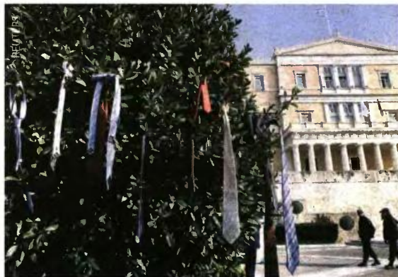
Παρατεταμένα τα τρακτέρ στους δρόμους, κρεμασμένες γραβάτες στα δέντρα μπροστά από τη Βουλή. Οι διαμαρτυρόμενοι έχουν το ίδιο αίτημα: να αποσυρθεί το ασφαλιστικό.

ΑΝΤΙΔΡΑΣΕΙΣ ΓΙΑ ΑΣΦΑΛΙΣΤΙΚΟ: ΟΙ ΑΓΡΟΤΕΣ ΣΤΑ ΜΠΛΟΚΑ, ΟΙ ΕΠΙΣΤΗΜΟΝΕΣ ΣΤΟΥΣ ΔΡΟΜΟΥΣ ΚΑΙ Η ΚΥΒΕΡΝΗΣΗ