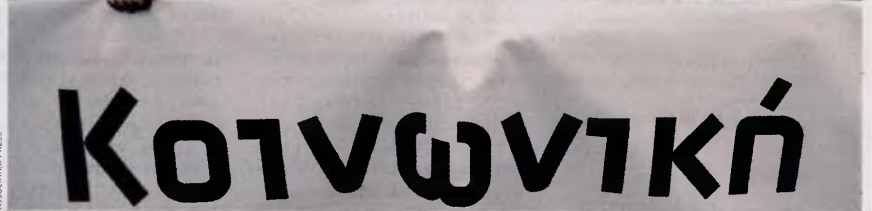
Περίπου 12.000 άτομα υπολογίζεται ότι συμμετείχαν στη χθεσινή πορεία στο κέντρο της Αθήνας.

Συνεδριάζουν εκ νέου σήμερα για να καθορίσουν τη συνέχεια και την ένταση των κινητοποιήσεων.