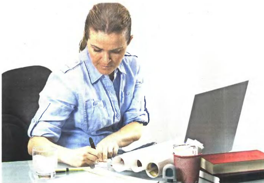
Το έτος θεμελίωσης παίζει καθοριστικό ρόλο στα πλασματικά έτη που αναγνωρίζονται

ΤΩΝ ΚΑΤΕΡΙΝΑΣ ΚΟΚΚΑΛΙΑΡΗ - ΓΙΑΝΝΗ ΦΩΣΚΟΛΟΥ