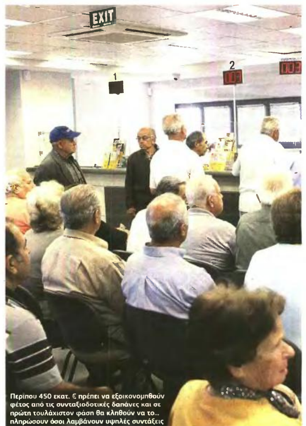
Περίπου 450 εκατ. € πρέπει να εξοικονομηθούν φέτος από τις συνταξιοδοτικές δαπάνες και σε πρώτη τουλάχιστον φάση θα «κλήθουν να το...» πληρώσουν όσοι λαμβάνουν υψηλές συντάξεις

στο ποσό κάτω από το οποίο δεν θα έπεφτε κανένας συνταξιούχος. Για παράδειγμα με τις τελευταίες μειώσεις από τα 1.000 ως τα 1.500 ευρώ επιβλήθηκε 5% περικοπή αλλά με κατώφλι τα 1.000 ευρώ, που σημαίνει ότι ένας συνταξιούχος με 1.400 ευρώ έχει μείωση 70 ευρώ ενώ ένας με 1.020 ευρώ έχει απώλεια μόνο 20 ευρώ. Ενώ από τα 1.500 ως τα 2.000 ευρώ η περικοπή είναι 10% αλλά με κατώφλι στα 1.425 ευρώ, που σημαίνει ότι στα 1.700 ευρώ η μείωση είναι 170 ευρώ, και η σύνταξη πάει στα 1.600 ευρώ ενώ στα 1.500 ευρώ η μείωση δεν είναι 150 ευρώ, αλλά 72 ευρώ γιατί σταματά στο κατώφλι των 1.425 ευρώ. Το σενάριο αυτό δεν συγκεντρώνει πιθανά θύματα εφαρμογής καθώς λόγω των παραπάνω «στρεβλώσεων» θα βρεθούν συνταξιούχοι που είχαν ήδη μεγάλες περικοπές να χάσουν ακόμη περισσότερα. ■