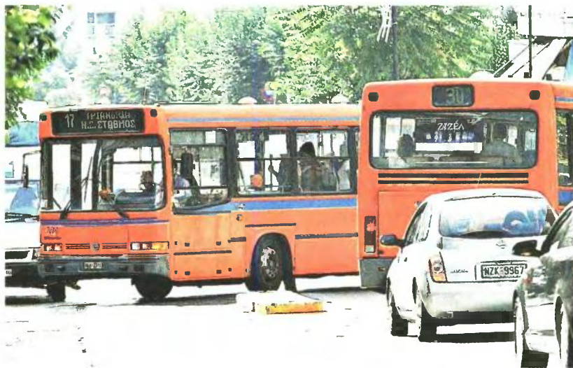
Δίκως λεωφορεία είναι σήμερα ο νομός Θεσσαλονίκης, λόγω επίσκεψης εργασίας των 2.367 εργαζομένων του ΟΑΣΘ

Να σημειωθεί ότι οι εργαζόμενοι του ΟΑΣΘ διεκδικούν τα δεδουλευμένα του Αυγούστου