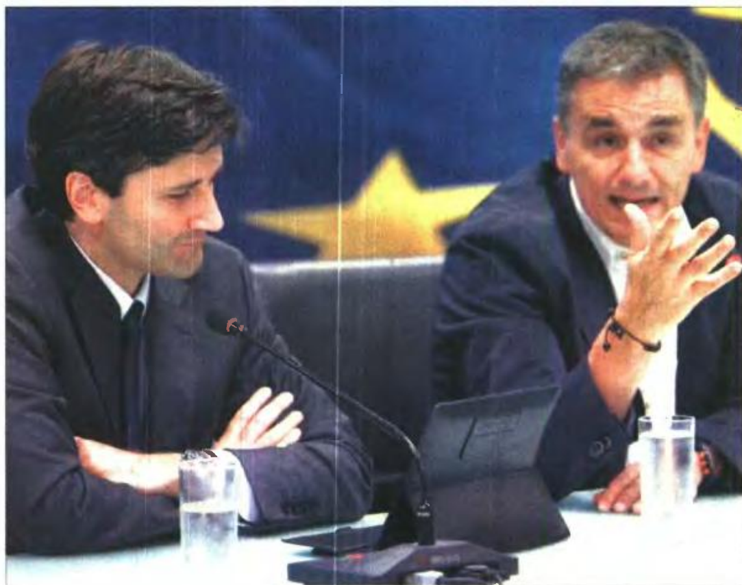
Ο υπ. Οικονομικών Εν. Τσακαλώτος (αριστερά) με τον αναπληρωτή υπ. Γ. Χουλιαράκη σε παλαιότερο στιγμιότυπο

• Οι απαλλαγές, οι εξαιρέσεις και οι μειωμένοι συντελεστές