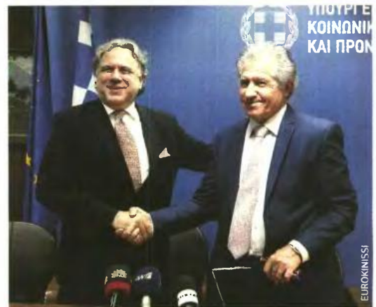
Ο νέος υπουργός Εργασίας Γ. Κατρούγκαλος (αριστερά) ξεκαθάρισε λίγο το τοπίο για τις μειώσεις στις συντάξεις.