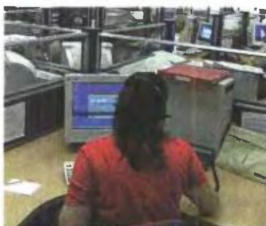
▲ ΟΙ ΑΠΟΧΩΡΗΣΕΙΣ αναμένεται να μειώσουν ακόμα περισσότερο τον αριθμό των δημοσίων υπαλλήλων

Το μαζικό κύμα φυγής καταγράφεται από υπαλλήλους που έχουν κατοχυρωμένα ασφαλιστικά δικαιώματα δηλαδή έχουν συμπληρώσει 25ετία και έχουν καταθέσει ήδη την πρώτη αίτηση παραίτησης, ενώ απαιτείται και δεύτερη αίτηση για την ολοκλήρωση του αιτήματος. Παράλληλα μεταξύ της κυβέρνησης και