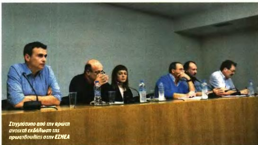
Στιγμιότυπο από την πρώτη ανοικτή εκδήλωση της πρωτοβουλίας στην ΕΣΗΕΑ

Συνδικαλιστές, πανεπιστημιακοί και αυτοδιοικητικοί ενώνουν τις φωνές τους για την επαναφορά των συλλογικών συμβάσεων στην Ελλάδα μέσω της νεοσύστατης πανευρωπαϊκής πρωτοβουλίας Mayday ● Αν και έγινε αναφορά στην υπογραφή του 3ου Μνημονίου, δεν κατονομάστηκαν οι ιθύνοντες και οι συνένοχοι του «πραξικοπήματος», πέρα από το γενικόλογο «ο νεοφιλελευθερισμός» και «οι θεσμοί»