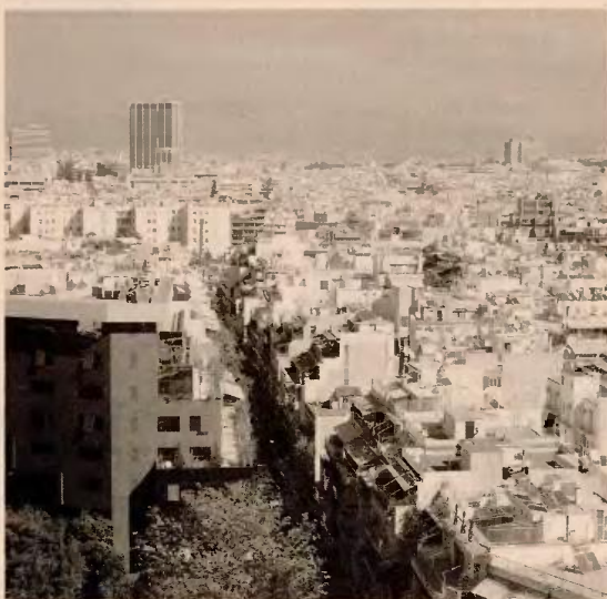
Το οικονομικό επιτελείο επεξεργάζεται σχέδιο αύξησης της φορολογίας στα εισοδήματα από ενοίκια.

Η κατάσταση που δημιουργήθηκε ανάγκασε τον κ. Αλεξιάδη να προβεί σε νέες δηλώσεις, καθώς και στην έκδοση ανακοίνωσης στην οποία κάνει λόγο για «ψέματα και συνειδητή παραπληροφόρηση» σχετικά με την επβολή φόρων στα εισοδήματα του 2015. Μάλιστα, στην ανακοίνωση που εξέδωσε τονίζει: «Οι αλλαγές που θα γίνουν στη φορολόγηση των ει-