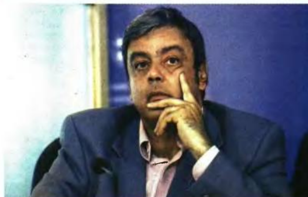
ΤΙΣ ΠΡΟΘΘΟΥΜΕΝΕΣ αλλαγές στο Δημόσιο συζήτησε ο αναπληρωτής υπουργός Διοικητικής Ανασυγκρότησης Χρ. Βερναρδάκης με τους εκπροσώπους των δανειστών