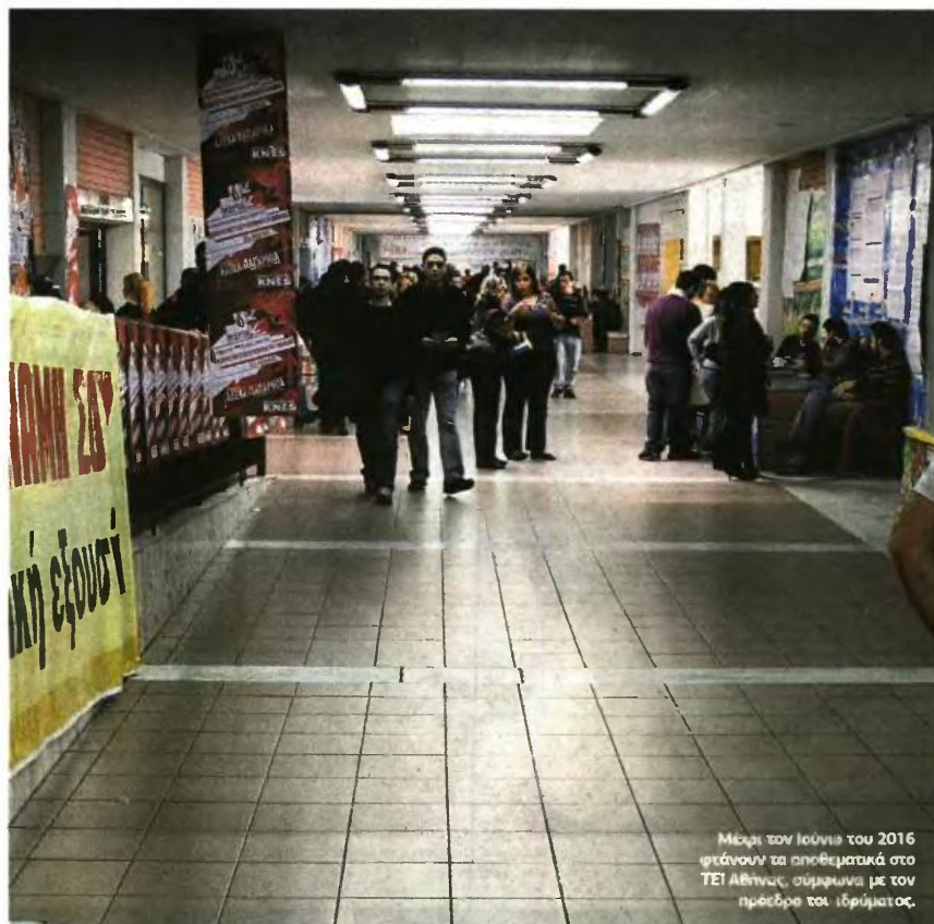
Μέχρι τον Ιούνιο του 2016 φτάνουν τα αποθεματικά στο ΤΕΙ Αθηνών, σύμφωνα με τον πρόεδρο του ιδρύματος.

ακόμα και στις φόρμες εργασίας για τα εργαστήρια των σπουδαστών Μηχανολογίας. Παράλληλα έκαναν λόγο για λίστες αναμονής στην παρακολούθηση των πρακτικών μαθημάτων αλλά και για μαθήματα που «κόβονται» από τα προγράμματα σπουδών γιατί δεν υπάρχει καθηγητής να τα διδάξει.