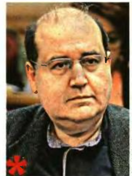
Ο υπουργός Παιδείας Νίκος Φίλης σχολιάζοντας το πρωτοσέλιδο της «Εφ.Συν.» επισήμανε ότι το υπουργείο συνεργάζεται με τους θεσμούς, είναι όμως επιβεβλημένο να παράγει νομοθετικό έργο σεβόμενο τις συνταγματικές επιταγές

Κυβερνητικές πηγές εντάσσουν την απάντηση του Κοστέλο στο να υποχρεωθεί η κυβέρνηση να ευθυγραμμιστεί με τις σκληρές μνημονιακές λογικές, ενώ προβληματίζονται αφού αν σήμερα εκτοξεύονται απειλές ακόμη και για δευτερεύουσας σημασίας ζητήματα, όπως αυτά του υπουργείου Παιδείας, τι πρόκειται να συμβεί αύριο σε μείζονα ανοιχτά θέματα, όπως το ασφαλιστικό, και δεν αποκλείουν τη σύγκρουση