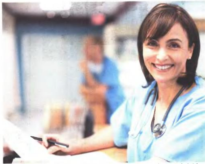
Η πλειονότητα των θέσεων αφορά νοσηλευτές, μεταφορείς ασθενών, βοηθούς θαλάμου και φαρμακοποιούς

Αναφορικά με τις ειδικότητες που θα συγκεντρώσουν την πλειονότητα των θέσεων είναι οι ακόλουθες οκτώ: ΤΕ Νοσηλευτικής, όπου αντιστοιχούν 35 θέσεις του Ν. 2643/1998, ΔΕ Βοηθών Νοσηλευτικής, στην οποία θα επιλεγούν 23 άτομα από κατηγορίες του Ν. 2643/1998, ΥΕ Μεταφορών Ασθενών, με τέσσερις θέσεις, ΥΕ Βοηθών Θαλάμου και ΠΕ Φαρμακοποιών με δύο άτομα ανά ειδικότητα