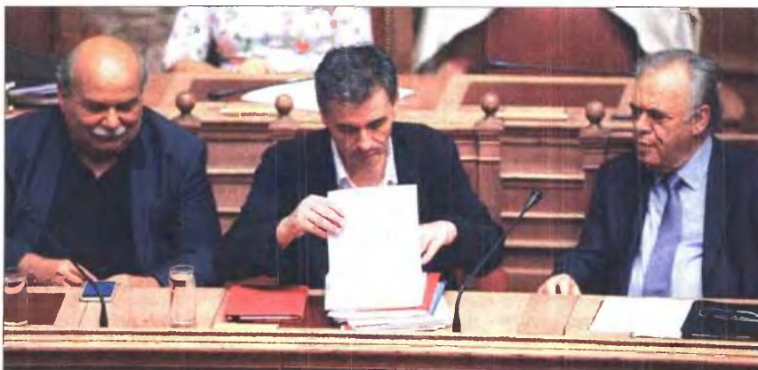
Από αριστερά: Ο Ν. Βούτσης, ο Έν. Τσακαλώτος και ο Ι. Δραγασιάς σε παλαιότερο στιγμιότυπο από τη Βουλή

Η εύρεση ισοδυναμίων μέτρων για να μην εφαρμοστεί η συγκεκριμένη ρύθρα δεν μοιάζει με εφικτό στόχο για το υπουργείο Εργασίας, έτσι οι περικοπές σε πάνω από 1.600.000 συντάξεις βρίσκονται προ των πυλών. Αλλωστε, ήδη έχει διαρρεύσει ότι σε αναλογιστική μελέτη για την επικουρική ασφάλιση, η οποία βρίσκεται υπό εξέλιξη, για το διάστημα έως τα τέλη του 2016 προκύπτει έλλειμμα ύψους 1,4 δισ. ευρώ. Ουσιαστικά, η μελέτη διαπιστώνει ότι την παραπάνω χρονική περίοδο δεν θα καταστεί δυνατό να εσπραχθούν από το ΕΤΕΑ περισ-