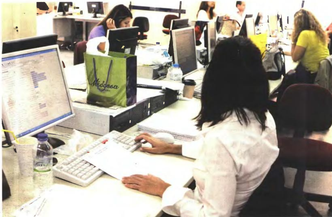
▲ Η 21η ΜΑΪΟΥ είναι η καταληκτική ημερομηνία όπου οι ενδιαφερόμενοι μπορούν να υποβάλουν αίτηση για την επανατοποθέτησή τους στις θέσεις που υπηρετούσαν

Αναλυτικά η εγκύκλιος Κατρούγκαλου αναφέρει για την επαναφορά του προσωπικού που έχει απολυθεί,