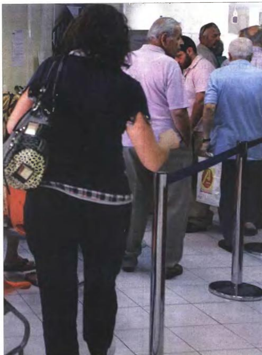
Ουρά συνταξιούχων στο ΙΚΑ

Αυτό σημαίνει ότι οι επόμενες γενιές, σε ένα συντριπτικά μεγάλο ποσοστό, για να καταφέρουν να βγουν στη σύνταξη θα πρέπει να έχουν συμπληρώσει ηλικιακό όριο άνω των 65 ετών.