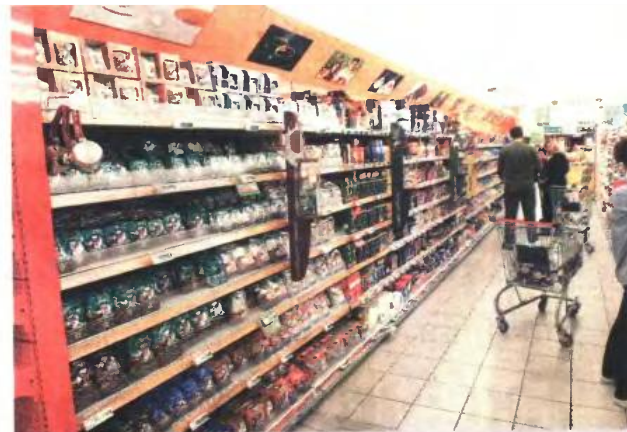
Η «μεταρρύθμιση» του ΦΠΑ θα φέρει τα νοικοκυριά αντιμέτωπα με αυξήσεις τιμών ακόμα κι ανάγκης όπως τρόφιμα και λογαριασμούς ρεύματος, νερού.

τα πάσης φύσεως πλαστικά και ξύλινα αντικείμενα, τα χημικά προϊόντα, τα απορρυπαντικά, τα είδη καθαρισμού, υγιεινής, καλλωπισμού κ.λπ., τα κοσμήματα, τα ρολόγια κ.λπ., το τέλν σταθερής και κινητής τηλεφωνίας, καθώς επίσης και οι υπηρεσίες που παρέχουν διάφοροι επιτηδευματίες (γυμναστήρια, σχολές χορού ντιστιτούτα αισθητικής, κομμωτήρια, κουρέια, συνεργεία επισκευής οχημάτων, επισκευαστές ηλεκτρικών και ηλεκτρονικών συσκευών κ.λπ.) και ελεύθεροι επαγγελματίες (δικηγόροι συμβολαιογράφοι, κτηματομεσίτες οικονομολόγοι, λογιστές-φοροτέχνες κ.λπ.) - θα μειωθεί από το 23% στο 18%-20%, με συνέπεια οι τιμές όλων αυτών των προϊόντων και των υπηρεσιών να μειωθούν κατά 2,43%-4%. ■