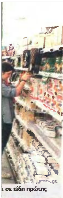
σε είδη πρώτης