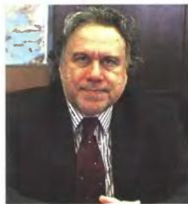
▲ Ο ΑΝΑΠΛΗΡΩΤΗΣ ΥΠΟΥΡΓΟΣ Διοικητικής Ανασυγκρότησης Γ. Κατρούγκαλος

■ Το προσωπικό της δευτεροβάθμιας εκπαίδευσης, του οποίου οι ειδικότητες καταργήθηκαν με το άρθρο 82 του ν. 4172/2013 και όσοι από το προσωπικό αυτό μετατάχθηκαν σε άλλες θέσεις, βάσει οριστικών πινάκων, μπορούν να επανέλθουν στις θέσεις που κατείχαν, εφόσον υποβάλουν αίτηση έως και την 21η Μαΐου 2015, στις κατά τόπον αρμόδιες Διευθύνσεις Δευτεροβάθμιας Εκπαίδευσης.