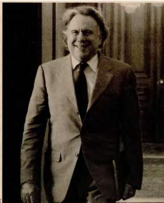
Ο υπουργός Εργασίας και Κοινωνικής Ασφάλισης, Γιώργος Κατρούγκαλος.

Από την ελληνική πλευρά, τέλος, εκφράζονται φόβοι πως οι θεσμοί θα αντιδράσουν και στη λύση της «προσωπικής διαφοράς», στο πλαίσιο του επανυπολογισμού των συντάξεων, προκειμένου να αποφευχθούν νέες μειώσεις στις ήδη καταβαλλόμενες συντάξεις, ακόμη και μετά το 2018. Είναι χαρακτηριστικό ότι ο υπουργός Εργασίας Γιώργος Κατρούγκαλος, κατά την πολυωρη παρουσίαση της πρότασης στην κοινοβουλευτική ομάδα του ΣΥΡΙΖΑ, επεσήμανε ότι είναι προετοιμασμένος να δώσει μάχη