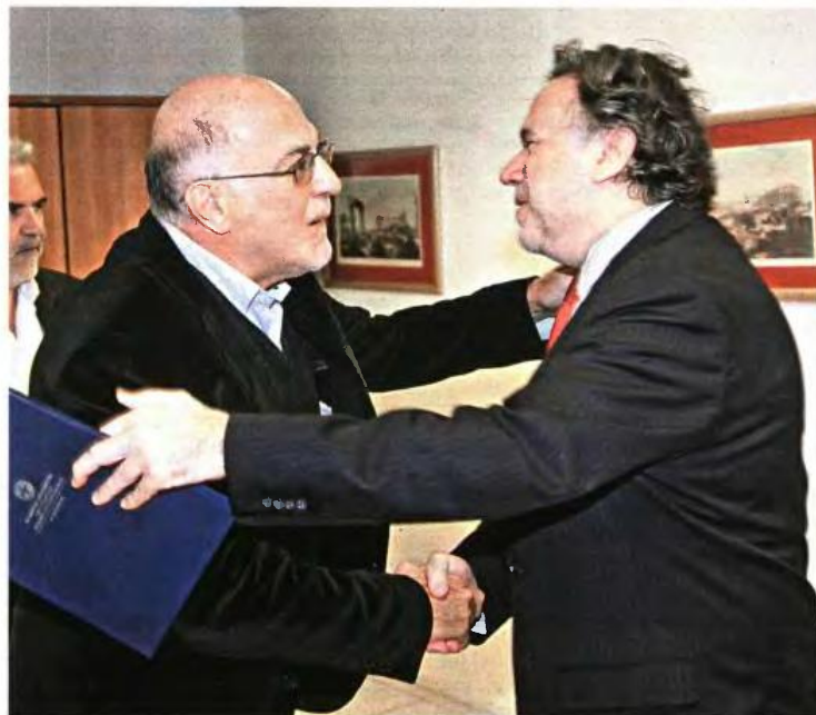
Ο υπουργός Εργασίας Γ. Κατρούγκαλος παρέδωσε στον πρόεδρο της ΟΚΕ τον (μπλε) φάκελο με τις προτάσεις του για την ασφαλιστική μεταρρύθμιση

Η ανάγκη να μην κατηγορηθεί για προσχηματικό διάλογο, αλλά και η χαλάρωση που έδωσαν οι δανειστές θέτοντας εκτός την ασφαλιστική μεταρρύθμιση από τη 2η δόση προαπαιτούμενων, δίνουν ανάσα στην κυβέρνηση... Πλέον σχεδιάζεται να κατατεθεί το σχετικό νομοσχέδιο στις 15 Ιανουαρίου, δίνοντας χώρο για τον κοινωνικό διάλογο ο οποίος άρχισε προχθές μέσω της Οικονομικής και Κοινωνικής Επιτροπής και αναμένεται να συνεχιστεί μετά τις 15 Δεκεμβρίου, όταν και η ΟΚΕ θα καταθέσει το πόρισμά της επί των βασικών κατευθύνσεων της μεταρρύθμισης.