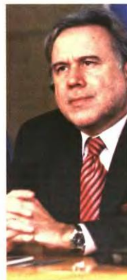
▲ Ο ΥΠΟΥΡΓΟΣ ΕΡΓΑΣΙΑΣ Γ. Κατρούγκαλος έχει δηλώσει πως στόχος είναι να προστατευτούν οι μικρές συντάξεις

■ Υπολογισμό από την αρχή και επανακαθορισμό των συντάξεων που ήδη καταβάλλονται με αναφορά στον νέο, ενιαίο τρόπο υπολογισμού της κύριας και επικουρικής σύνταξης για παλαιούς και νέους ασφαλισμένους. Σημειώνεται πως ο υπουργός Εργασίας Γ. Κατρούγκαλος έχει δηλώσει πως στόχος είναι