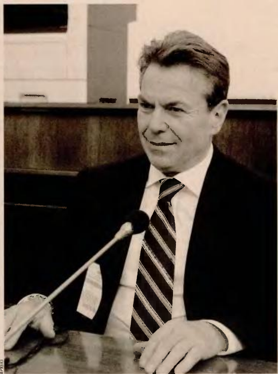
Ο υφυπουργός Κοινωνικών Ασφαλίσεων Τάσος Πετρόπουλος, μιλώντας στην «Κ», επισημαίνει ότι όλα τα προβλήματα και οι ασάφειες που προκύπτουν από την εγκύκλιο θα αντιμετωπιστούν με νέες παρεμβάσεις από το υπουργείο Εργασίας και όπου χρειαστεί θα εκδοθούν νέες εγκυκλίους εντός της ερχόμενης εβδομάδας.

Στην επίμαχη εγκύκλιο αναφέρεται και η διάταξη που οδηγεί σε σταδιακή αύξηση των ορίων ηλικίας πλήρους και μειωμένης συνταξιοδότησης, χωρίς να αποσαφηνίζεται το αλαλούμ που