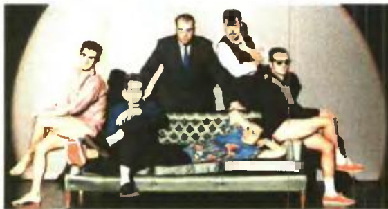
«Μοjo» ξανά από το Σάββατο στο θέατρο Πόρτα

Το θέατρο Πόρτα (Μεσογείων 59, τηλ. 210-7711.333) προσφέρει σε 300 θεατρόφιλους από ένα πάσο διαρκείας για τις 49 φετινές του παραγωγές στη συμβολική τιμή των 50 ευρώ (ισχύει έως τέλος Οκτωβρίου). Μόνο για σήμερα,