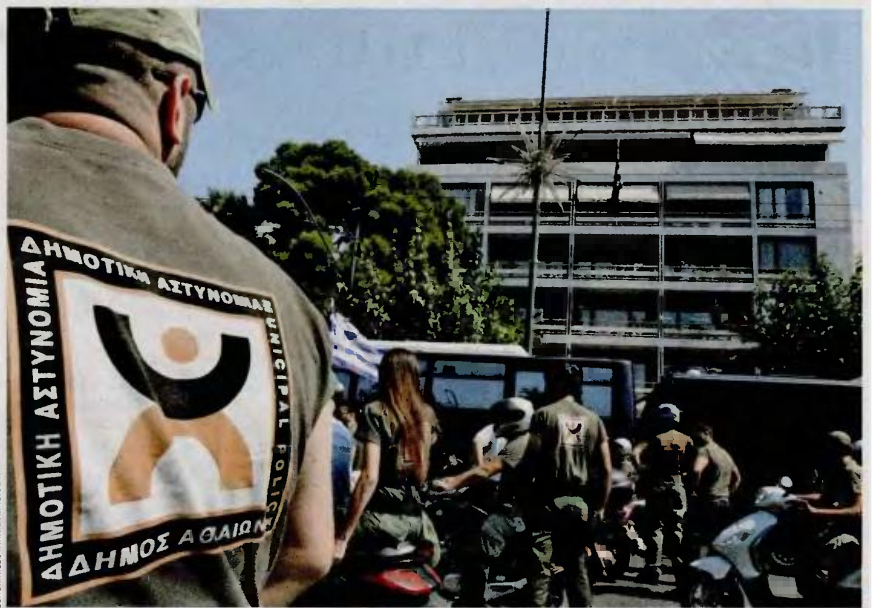
Στον Δήμο Αθηναίων, όπου υπηρετούσαν 1.023 δημοτικοί αστυνομικοί, έχουν υποβάλει αίτηση επιστροφής 300.

Περίπου 106 δημοτικούς αστυνομικούς διέθετε ο Δήμος Ρόδου, αλλά όπως τονίζει ο δήμαρχος Φώτης Χατζηδιάκος «δεν περιμένουμε στο νέο σώμα να ενταχθούν περισσότερα από 40 άτομα. Το νούμερο είναι οριακό, αλλά θα