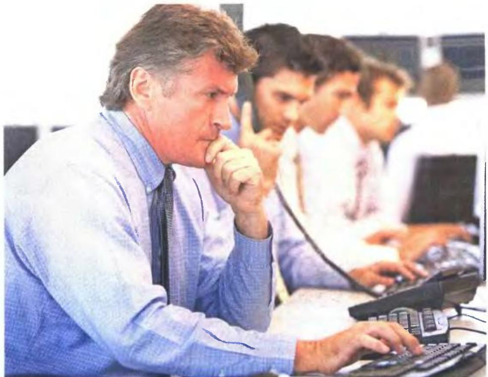
Για όσους θεμελιώνουν δικαίωμα μετά την 1η Ιανουαρίου 2013 δεν υπάρχει ειδικό καθεστώς. Πλήρης σύνταξη δίνεται στα 67 και όπου προβλέπεται μειωμένη, αυτή καταβάλλεται στα 62

1 Ασφαλισμένοι μέχρι 31 Δεκεμβρίου 1982. Προβλέ-