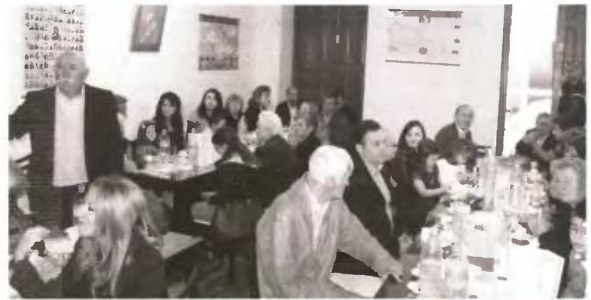
Δεκάδες πολύτεκνοι και όχι μόνο, συμμετείχαν στον εορτασμό της με τη λιτή εκδήλωση που ακολούθησε

διωγμό και οι - κατά καιρούς - μεγάλες διακηρύξεις, φαίνεται ότι αποτελούν φρούδες υποσχέσεις. Η πολύτεκνη οικογένεια βάλλεται και παραμένει απρο-