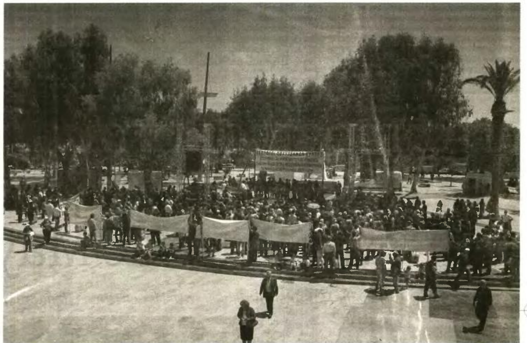
Σε παγκρήτια συνάντηση με τους βουλευτές και τους φορείς, πιθανότατα την άλλη Κυριακή στο Ηράκλειο, οι τέσσερις Σύλλογοι Πολυτέκνων του νησιού θα καταγγείλουν συνταγματική εκτροπή της σημερινής κυβέρνησης σε βάρος τους.

Συγκεκριμένα, ενώ μέχρι τότε ίσχυε το εισοδηματικό κριτήριο 15.000 ευρώ το χρόνο συν 900 ευρώ για κάθε παιδί, ως κατώφλι μέχρι το οποίο να δικαιούται μια οικογένεια να ενταχθεί στο πρόγραμμα, τώρα ισχύει το ποσό των 8.700 ευρώ, ενώ καταργείται ο υπολογισμός οποιουδήποτε ποσού για κάθε παιδί, ανεξάρτητα από το πόσα παιδιά έχει η κάθε οικογένεια.