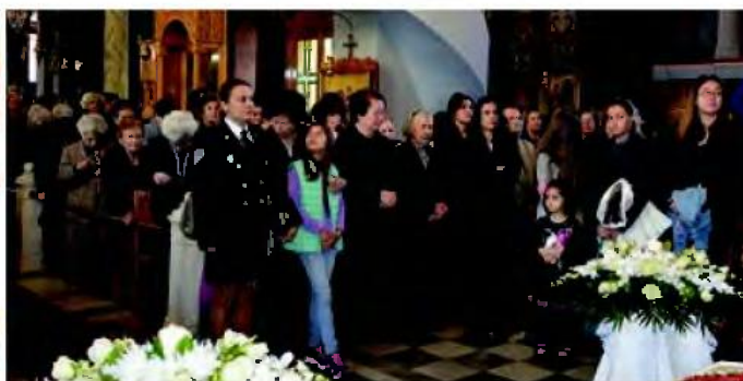
Επιμνημόσυνη δέση χθες στον Ι. Ναό Αγ. Αθανασίου Πύργου από τον Σύλλογο Πολυτέκνων προς τιμήν των προσατών τους Αγίων Τερεντίου και Νεονίηνης