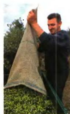
▲ ΠΟΣΟ 600 εκατ. ευρώ θα διατεθεί για τους τομείς της βιολογικής γεωργίας και κτηνοτροφίας

■ Μεταποίηση αγροτικών προϊόντων (254 εκατ. ευρώ). Παρέχονται διευρυνμένες δυνατότητες για πρώτη φορά ως προς την επι-