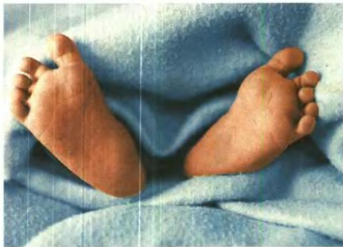
Οι αστυνομικοί της ασφάλειας Σερρών εξακολουθούν να ερευνούν την υπόθεση, καθώς θεωρούν ότι πίσω απ' αυτές τις υιοθεσίες κρύβεται ολόκληρο κύκλωμα που πράττει το ίδιο και για άλλα παιδιά Ρομά.

Επιχείρηση είσπραξης προνοιακών επιδομάτων μέσω... αύξησης της οικογένειάς τους κατηγορούνται ότι έστησαν δύο Ρομά στον οικισμό Διαβατών της Θεσσαλονίκης. Υιοθέτησαν παράνομα δύο αγόρια και ένα κορίτσι όταν ήταν βρέφη και στη συνέχεια με ψευδομάρτυρες τα παρουσίασαν ως δικά τους παιδιά, παίρνοντας από το κράτος τα επιδόματα πολυτέκνων.