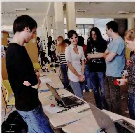
Ο δημογραφικός παράγοντας είναι πιθανό να επιδεινωθεί περαιτέρω, καθώς οι άνθρωποι σε ηλικία που μπορεί να εργαστούν εγκαταλείπουν την Ελλάδα για καλύτερες προοπτικές αλλού.

Είναι πιθανό να μετριαστούν οι επιπτώσεις από την αρνητική τάση για τον πληθυσμό σε ηλικία εργασίας εάν η συμμετοχή στην αγορά