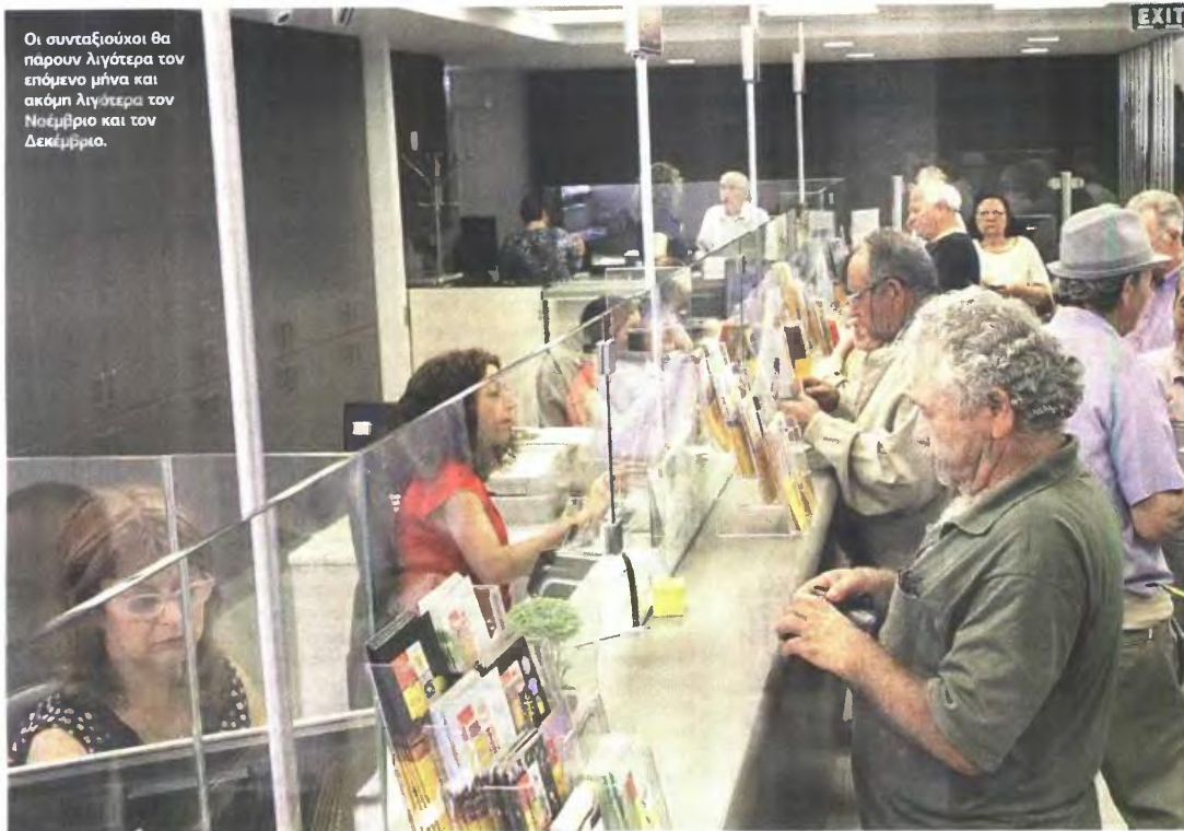
Οι συνταξιούχοι θα πάρουν λιγότερα τον επόμενο μήνα και ακόμη λιγότερα τον Νοέμβριο και τον Δεκέμβριο.