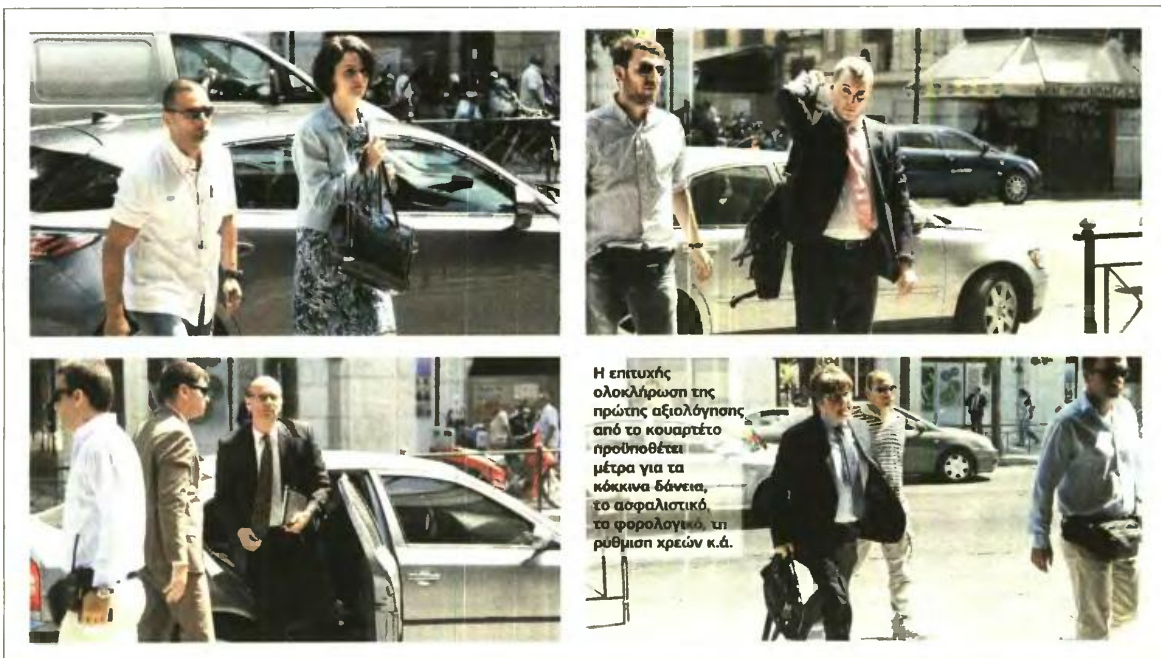
Η επιτυχή ολοκλήρωση της πρώτης αξιολόγησης από το κουαρτέτο προϋποθέτει μέτρα για τα κόκκινα δάνεια, το ασφαλιστικό, τα φορολογικά, τη ρύθμιση χρεών κ.ά.

ΜΕΧΡΙ ΤΕΛΟΣ ΟΚΤΩΒΡΙΟΥ ΠΡΕΠΕΙ ΝΑ ΥΛΟΠΟΙΗΘΟΥΝ 52 ΠΡΟΑΠΑΙΤΟΥΜΕΝΑ ΤΟΥ ΜΝΗΜΟΝΙΟΥ