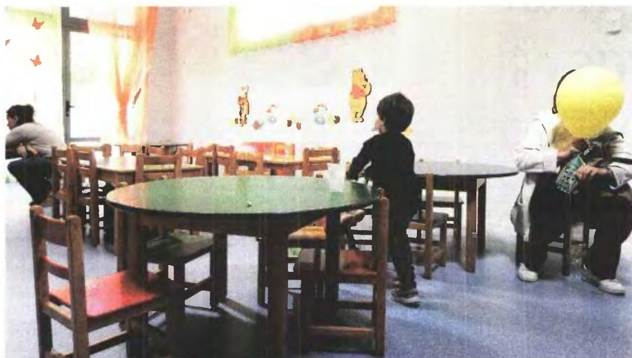
ΕΥΡΩΚΙΝΗΣΗ ΓΕΩΡΓΙΑ ΠΑΝΑΓΟΠΟΥΛΟΥ

Π ράσινο φως για την πρόσληψη 1.015 υπαλλήλων σε παιδικούς σταθμούς και άλλες προνοιακές δομές των δήμων της χώρας έδωσαν τα αρμόδια υπουργεία προκειμένου να καλυφθούν ανάγκες που θα προκύψουν τέλη Αυγούστου - αρχές Σεπτεμβρίου με την έναρξη λειτουργίας των σταθμών. Από τις θέσεις, οι 826 αφορούν τους παιδικούς σταθμούς, στους οποίους θα γίνουν προσλήψεις με συμβάσεις ιδιωτικού δικαίου ορισμένου χρόνου δι-