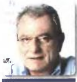
γράφει ο ΚΩΣΤΑΣ ΚΑΡΑΒΕΛΛΑΣ