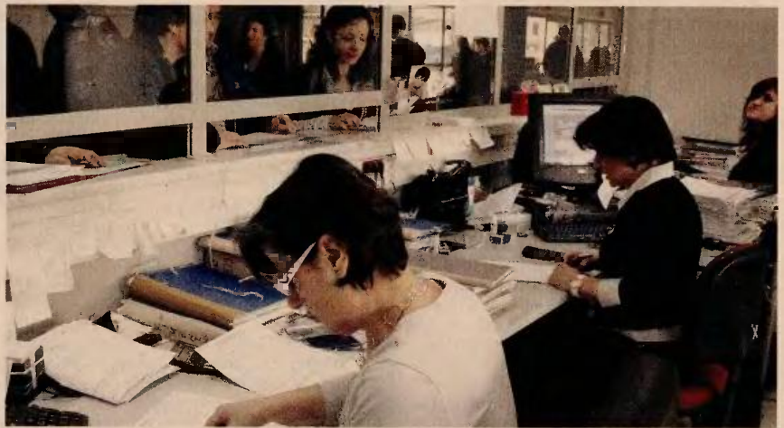
Τα φορολογικά έσοδα το δεύτερο εξάμηνο του 2015 θα πρέπει να ξεπεράσουν τα 25 δισ. ευρώ, τη στιγμή που στο πρώτο εξάμηνο ήταν λιγότερα από 17 δισ. ευρώ.

Με αυτά τα δεδομένα είναι προφανές ότι και τον Ιούλιο θα υπάρξει τεράστια υστέρηση εσόδων, παρά το γεγονός ότι χιλιάδες φορολογούμενοι υπό τον φόβο του «κουρέματος» καταθέσεων έσπευσαν να προπληρώσουν υποχρεώσεις καταβάλλοντας πε-