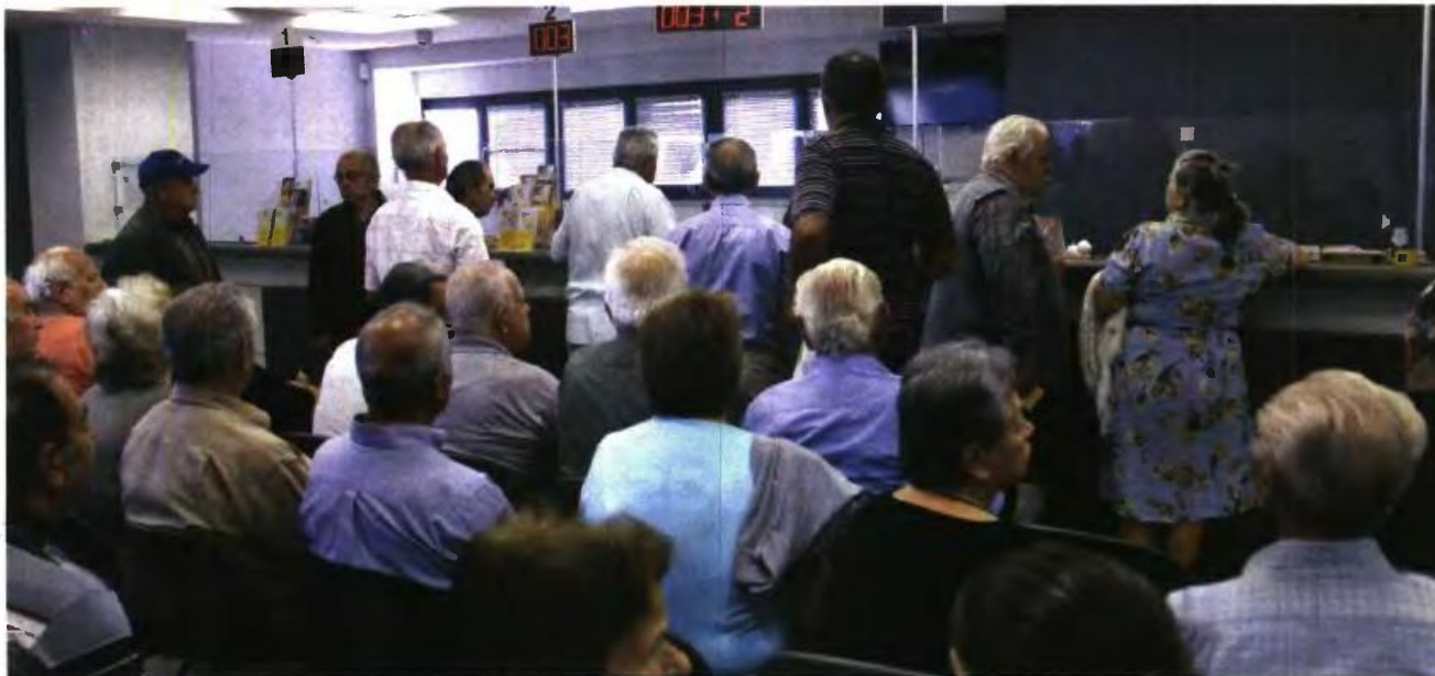
Μεγάλοι καμένοι από το μαχαίρι στις υψηλές επικουρικές αναμένεται να είναι τραπεζοϋπάλληλοι, ναυτικοί πράκτορες, εργαζόμενοι σε ΔΕΚΟ, εμποροϋπάλληλοι κ.ά.