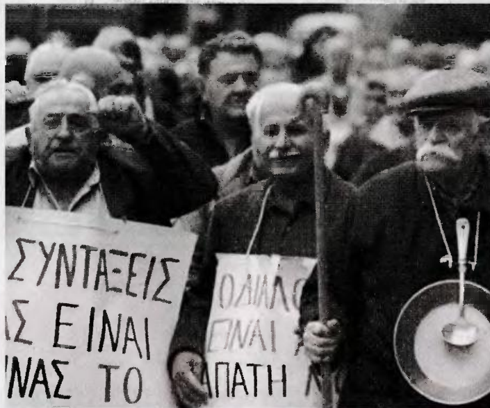
«Κάθε πέρσι και καλύτερα» σκέφτονται οι πολίτες, που θα βγουν στη σύνταξη από την 1-1-2022.

Τη γενική αύξηση των ορίων ηλικίας συνταξιοδότησης από την 1-1-2022, για πλήρη σύνταξη στο 67ο έτος και για μειωμένη σύνταξη στο 62ο έτος της ηλικίας, προβλέπει η νέα εγκύκλιος του υπουργείου Εργασίας. Με τις διατάξεις αυτές, από 1.1.2022, θεσπίζονται ως όρια ηλικίας συνταξιοδότησης για θεμελίωση συνταξιοδοτικού δικαιώματος πλήρους σύνταξης λόγω γήρατος για κάθε κατηγορία ασφαλισμένων, των Οργανισμών Κοινωνικής Ασφάλισης, συμπεριλαμβανομένης της Τράπεζας της Ελλάδος, το 62ο έτος της ηλικίας (με 40 έτη ή 12.000 ημέρες ασφάλισης) και το 67ο έτος της ηλικίας (με 4.500 ημέρες ή 15 έτη ασφάλισης). Επίσης, από 1.1.2022, θεσπίζεται ως όριο ηλικίας συνταξιοδότησης για θεμελίωση συνταξιοδοτικού δικαιώματος μειωμένης σύνταξης λόγω γήρατος, το 62ο έτος της ηλικίας με 4.500 ημέρες ή 15 έτη ασφάλισης.