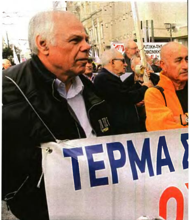
Όσο υψηλότερος είναι ο μισθός ή το εισόδημα του ασφαλισμένου, τόσο χαμηλότερο θα είναι το ποσοστό αναπλήρωσης της αναλογικής σύνταξης που θα λαμβάνει