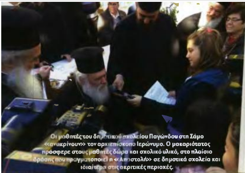
Οι μαθητές του δημοτικού σχολείου Παγωνίου στη Σάμο «ανακρίνουν» τον αρχιεπίσκοπο Ιερώνυμο. Ο μακαριότατος πρόσφερε στους μαθητές δώρα και σχολικό υλικό, στο πλαίσιο δράσης που πραγματοποιεί η «Αποστολή» σε δημοτικά σχολεία και ιδιαίτερα στις ακριτικές περιοχές.