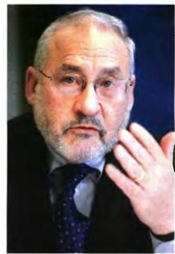
ΣΤΟ ΕΥΡΩΠΑΙΚΟ Κοινοβούλιο θα απευθυνθεί η κυβέρνηση για τον ορισμό του προέδρου της Επιτροπής Σφικτών για τα εργασιακά, με τους δανειστές να πιεζονται για μεγαλύτερη ευελιξία στην αγορά εργασίας

■ ΣΚΛΗΡΗ ΜΑΧΗ με τους δανειστές αναμένεται να δώσει το προσεχές διάστημα η κυβέρνηση, προκειμένου να μην αλλάξουν επί τα χείρω οι εργασιακές σχέσεις στη χώρα. Σύμφωνα με πληροφορίες της «R», κυβέρνηση και δανειστές δεν έχουν καταλήξει ποια θα είναι η σύσταση της 9μελούς επιτροπής για την επανεξέταση της εργασιακής νομοθεσίας που ισχύει στην Ελλάδα, με γνώμονα τις «βέλτιστες πρακτικές» που εφαρμόζονται σε άλλες ευρωπαϊκές χώρες. Η κυβέρνηση προτείνει να οριστεί πρόεδρος της επιτροπής ο νομπελίστας οικονομολόγος Τζόζεφ Στίγκλιτς, ενώ οι δανειστές τον νομπελίστα οικονομολόγο Χριστόφορο Πισσαρίδη. Ο υπουργός Εργασίας Γιώργος Κατρούγκαλος θα εισηγήσει ο πρόεδρος να οριστεί από το Ευρωπαϊκό Κοινοβούλιο. Οι δανειστές επιμένουν στην ενίσχυση της ευελιξίας στην αγορά εργασίας με γνώμονα τις προτάσεις της Παγκόσμιας Τράπεζας και του ΟΟΣΑ.