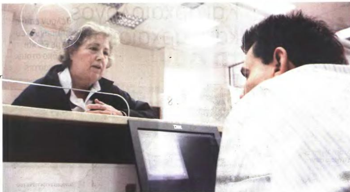
▲ Η ΣΥΝΟΛΙΚΗ ΔΑΠΑΝΗ για το ΕΚΑΣ το 2015 δεν αποκλείεται να αγγίξει, σύμφωνα με εκτιμήσεις ειδικών, το 1 δισ. ευρώ