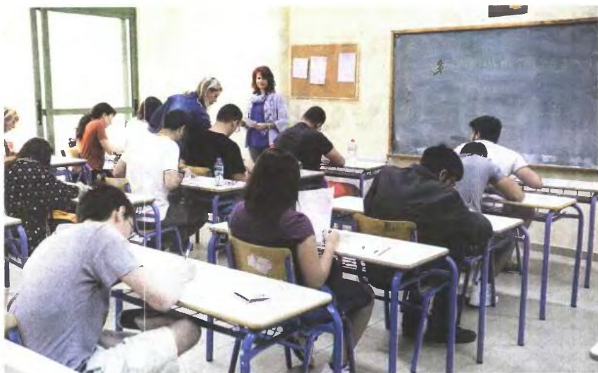
Εναλλακτικά οι φετινοί υποψήφιοι μπορούν να συμμετάσχουν στις Πανελλαδικές με το νέο σύστημα. Οι απόφοιτοι θα πρέπει να δηλώσουν μέχρι τον Σεπτέμβριο την Ομάδα Προσανατολισμού και μέσα στη σχολική χρονιά το «πακέτο» μαθημάτων.

Δικαίωμα εξετάσεως με το... παλιό σύστημα θα έχουν οι φετινοί απόφοιτοι των πανελλαδικών εξετάσεων. Από την επόμενη χρονιά, οι εισαγωγικές εξετάσεις αλλάζουν με μείωση των μαθημάτων από έξι, που ίσχυαν μέχρι σήμερα, σε τέσσερα και με εντελώς διαφορετική κατανομή των σχολών στα πέντε νέα επιστημονικά πεδία που έχουν δημιουργηθεί. Το νομοσχέδιο δίνει τη δυνατότητα στην παραπάνω κατηγορία και μόνο για το σχολικό έτος 2015-2016 να εξεταστεί και την επόμενη χρονιά με το σύστημα των έξι μαθημάτων διεκδικώντας μία θέση στο σύνολο του αριθμού εισακτέων