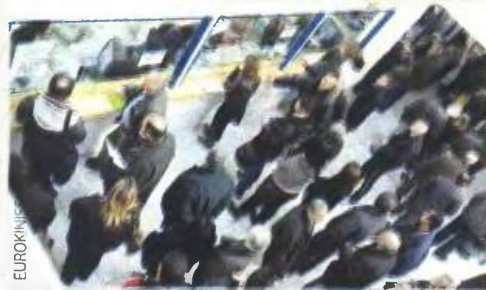
Εντυπωσιακή η ανταπόκριση του κόσμου στη νέα ρύθμιση για την τμηματική καταβολή των ληξιπρόθεσμων προς το Δημόσιο.

ΤΗΝ ΙΚΑΝΟΠΟΙΗΣΗ ΤΟΥΣ εκφράζουν στο υπουργείο Οικονομικών για την αποδοχή που έχει η νέα ρύθμιση για την τμηματική καταβολή των ληξιπρόθεσμων οφειλών προς το Δημόσιο έως και σε 100 μηνιαίες δόσεις.