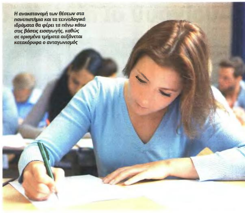
Η ανακατανομή των θέσεων στα πανεπιστήμια και τα τεχνολογικά ιδρύματα θα φέρει τα πάνω κάτω στις βάσεις εισαγωγής, καθώς σε ορισμένα τμήματα αυξάνεται κατακόρυφα ο ανταγωνισμός

2 Η οικονομική κρίση που μαστιάζει τις οικογένειες αναγκάζει χιλιάδες υποψηφίους να επιλέξουν τμήματα στο μηχανογραφικό με βασικό κριτήριο να εδρεύουν κοντά στον τόπο κατοικίας τους καθώς βάζουν σε δεύτερη μοίρα το γνωστικό αντικείμενο που επιθυμούν να σπουδάσουν. Αυτό το δεδομένο, ω-