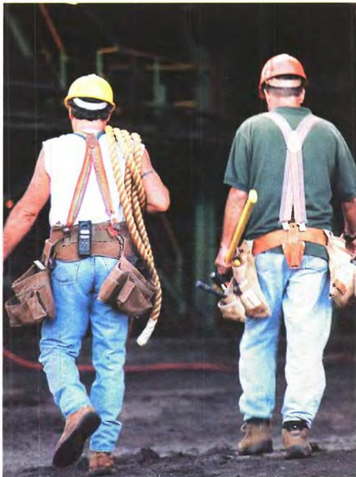
▲ ΑΓΕΦΥΡΩΤΕΣ ΠΑΡΑΜΕΝΟΥΝ οι διαφορές και στις επικουρικές. Ενα σενάριο είναι να μη μειώνονται οι συντάξεις κάθε φορά που προκύπτει έλλειμμα, αλλά να γίνεται περιθώριο ενός έτους για να κλείσει το κενό

Βασικό αγκάθι στο Ασφαλιστικό είναι οι συντάξεις, με τους δανειστές να ζητούν νέες παρεμβάσεις και εφαρμογή διατάξεων (π.χ. ρήτρα μηδενικού ελλείμματος) που έχει παγώσει η κυβέρνηση. Σύμφωνα με τον γενικό γραμματέα Γ. Ρωμανιά,