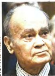
ΑΠΕΡΕ ΟΣΤΕΡΕ ΠΑΠΑΝΔΡΕΟΥ

Σημειώνεται ότι ο ένας στους τρεις ασφαλισμένους έχει τη δυνατότητα να βγει στη σύνταξη πρόωρα πριν από τη συμπλήρωσή του 62ου έτους της ηλικίας του. Μεταξύ των άλλων προκείται για ασφαλισμένους πριν από το 1983 που αποχωρούν με 35ετία, γυναίκες που θεμελιώσαν δικαίωμα μέχρι το τέλος του 2010 αλλά και εργαζομένους στα βαρέα και ανθυγιεινά επαγγέλματα. Μία σειρά ασφαλιστικών διατάξεων δίνει δυνατότητα εξόδου με μειωμένη σύνταξη, από τα 50 έως τα 60 για όσους πρόλαβαν να θεμελιώσουν δικαίωμα μέχρι το τέλος του 2012, με μεγάλες κερδισμένες τις μπότες ανηλίκων. Για όσους κλειδώνουν το δικαίωμα από το 2013