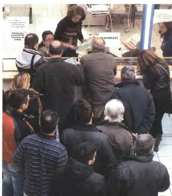
▲ ΑΝΑΠΡΟΣΑΡΜΟΓΕΣ ΣΕ 6 ΦΟΡΟΥΣ ΑΚΙΝΗΤΩΝ ΦΕΡΝΟΥΝ ΟΙ ΝΕΕΣ ΑΝΤΙΚΕΙΜΕΝΙΚΕΣ ΤΙΜΕΣ ΠΟΥ ΑΝΑΜΕΝΕΤΑΙ ΝΑ ΑΝΑΚΟΙΝΩΘΟΥΝ ΣΤΟ ΤΕΛΟΣ ΙΟΥΝΙΟΥ