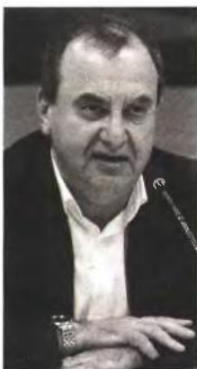
Ο αναπληρωτής υπουργός Κοινωνικής Ασφάλισης Δημήτρης Στρατούλης αναφερόμενος στην υπόθεση του ΤΕΑΠΕΤΕ, διαβεβαίωσε ότι η Δικαιοσύνη θα αποδώσει ευθύνες σε όσους καταχράστηκαν δημόσιο χρήμα.

ασφαλισμένων στο ΕΤΕΑ στο οποίο εντάχθηκε. Όπως αναφέρεται στο πόρισμα «στο πλαίσιο διερεύνησης σχετικής κατηγορίας ο γενικός επιθεωρητής Δημόσιας Διοίκησης με το υπ' αριθμ. πρωτ. ΓΕΔΔ Φ.731.14/13331/26-5-2014 έγγραφο του ζήτησε ενημέρωση για το βάσιμο ή μη της κατηγορίας περί ύπαρξης σημαντικού αριθμού συνταξιούχων του πρώην ΤΕΑΠΕΤΕ, οι οποίοι επί σειρά ετών λάμβαναν παρανόμως δύο συντάξεις και την κύρια σύνταξη από το ΙΚΑ ΕΤΑΜ και το σύνολο της προσυνταξιοδοτικής παροχής αρχικά από το Ενιαίο Ταμείο Επικουρικής Ασφάλισης Μισθωτών (ΕΤΕΑΜ) και στη συνέχεια από το Ενιαίο Ταμείο Επικουρικής Ασφάλισης (ΕΤΕΑ), αντί μέρους αυτής».