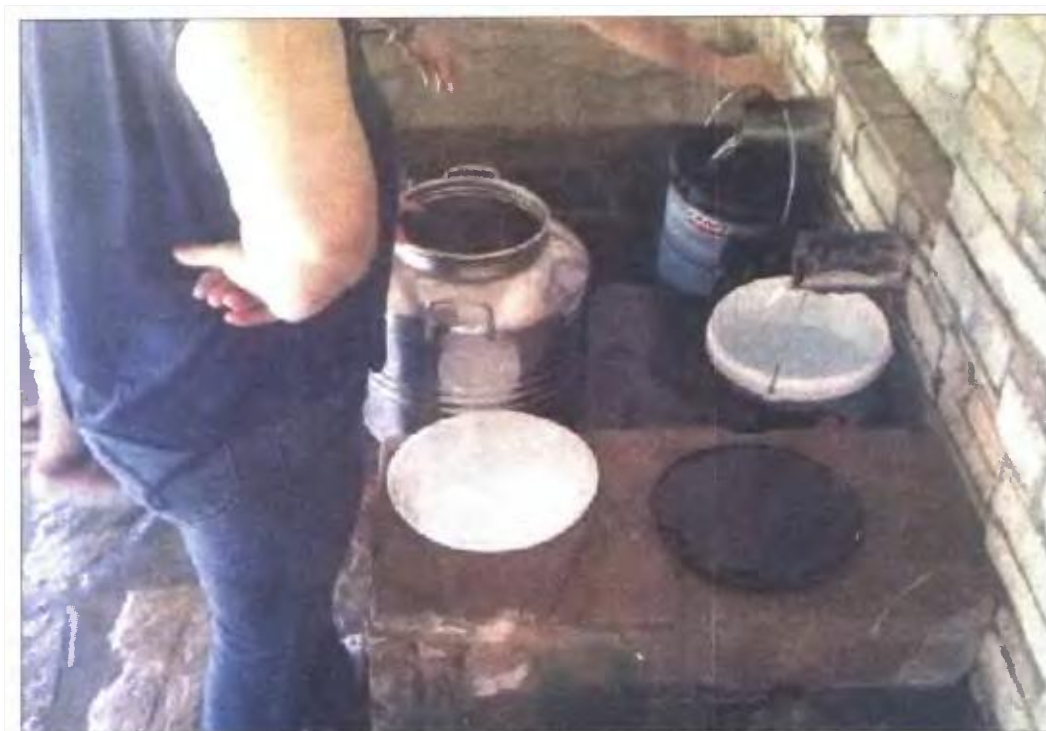
Κάτοικοι του χωριού Στανός σχηματίζουν ουρές στην πηγή που βρίσκεται έξω από το χωριό για να προμηθευτούν πόσιμο νερό!