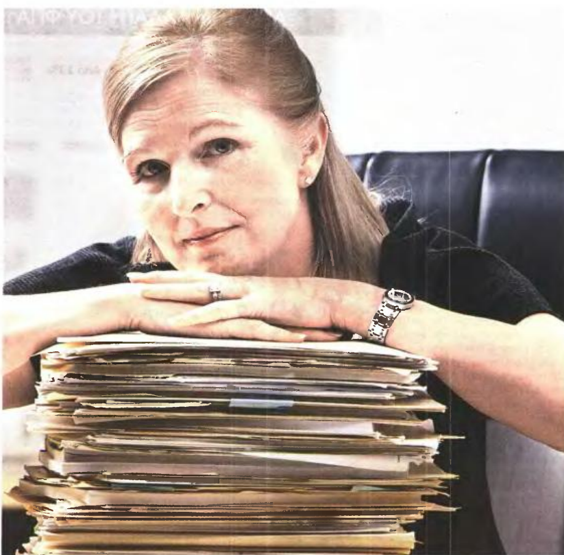
▲ ΣΤΟΥΣ ΜΕΓΑΛΟΥΣ ΧΑΜΕΝΟΥΣ των αλλαγών στο Ασφαλιστικό συγκαταλέγονται οι μητέρες, καθώς θα δουν τα όρια εξόδου να αυξάνονται από 6 μήνες μέχρι και 15 χρόνια

Τα όρια ηλικίας προβλέπεται να αυξάνονται κατά ένα βήμα το έτος. Σύμφωνα με το προσχέδιο, διασώζονται βαρέα και ανθυγιεινά, μητέρες παιδιών ανίκανων για εργασία, σύζυγοι, γονείς και αδελφοί αναπήρων, ασφαλισμένοι ανάπηροι, αλλά και όσοι έχουν θεμελιωμένο δικαίωμα μέχρι 30/06/2015. Υπολογίζεται πως 130.000 ασφαλισμένοι έχουν «κλειδώσει» και τον χρόνο ασφάλισης και το όριο ηλικίας κι ενδοχόμενη παραβίαση των δικαιωμάτων τους χαρακτηρίζεται από ειδικούς ως «πράσινη πράξη». Θίγονται, ωστόσο, όσοι μπορούσαν να φύγουν μόνο με τον χρόνο ασφάλισης και χωρίς όριο ηλικίας. Για αυτούς προβλέπεται η προσθήκη των εξαμήνων να ξεκινάει από τον Ιανουάριο με όριο τα 58 (εφόσον η συνταξιοδότηση γίνεται με 35ετία και σε κάθε άλλη περίπτωση με όριο τα 55). Ειδικό της κοινωνικής ασφάλισης εκτιμούν πως οι διατάξεις «κακομπούν» τρίτεκνες μητέρες σε δημοσιο και ευρύτερο δημόσιο τομέα που έφευγαν με 20ετία, ενδοχόμενοι και ένστολοι που φεύγουν χωρίς όριο ηλικίας με 25ετία.