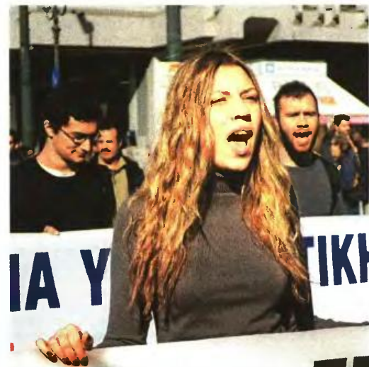
Διαμαρτυρία εργαζομένων έξω από το υπουργείο Εργασίας την περασμένη Παρασκευή. Με το νέο Ασφαλιστικό για τις νέες επικουρικές συντάξεις το ποσοστό αναπλήρωσης πέφτει για 40 έτη ασφάλισης στο 18%, όταν σήμερα κάποιος μπορούσε να λάβει επικουρική σύνταξη ακόμη και 40%-50% της κύριας σύνταξης του για 35 έτη ασφάλισης

Συγκεκριμένα στο νομοσχέδιο αναφέρεται: «Μέχρι την ολοκλήρωση του προγράμματος δημοσιονομικής προσαρμογής οι συντάξεις συνεχίζουν να καταβάλλονται στο ύψος που είχαν κατά τη δημοσίευσή του νόμου. Μετά την ολοκλήρωση του προγράμματος δημοσιονομικής προσαρμογής, εφόσον το καταβαλλόμενο ποσό των συντάξεων αυτών είναι μεγαλύτερο από αυτό που προκύπτει από τον υπολογισμό τους, το επιπλέον ποσό εξακολουθεί να καταβάλλεται στον δικαιούχο ως προσωπική διαφορά, απομειούμενη μέχρι την τελική αντιστοίχιση με τις συντάξεις όσων θα συνταξιοδοτηθούν μετά τη θέση σε ισχύ του νόμου αυτού».