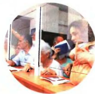
Από την 1/1/2017 προβλέπεται επίσης πως θα επανεξεταστούν οι παροχές σε είδος και σε χρήμα (νοσήλια σε νοσοκομεία, ιατρικές εξετάσεις κ.ά.) του Ενιαίου Ταμείου.

και ενεργή διαχείριση. Τα ακίνητα εκτιμούνται σε αντικειμενικές αξίες στα 1,43 δις. ευρώ και περιλαμβάνουν πολυώροφα κτίρια, επαγγελματικούς χώρους, ξενοδοχεία, νοσοκομεία, αγροτεμαχία και διαμερίσματα που σε αξιοσημείωτο βαθμό μένουν αναξιοποίητα. Η κυβέρνηση προσδοκά από τη συγκεντρωτική αξιοποίηση της περιουσίας να εξασφαλίσει έσοδα της τάξης των 300 - 500 εκατομμυρίων ευρώ ετησίως.