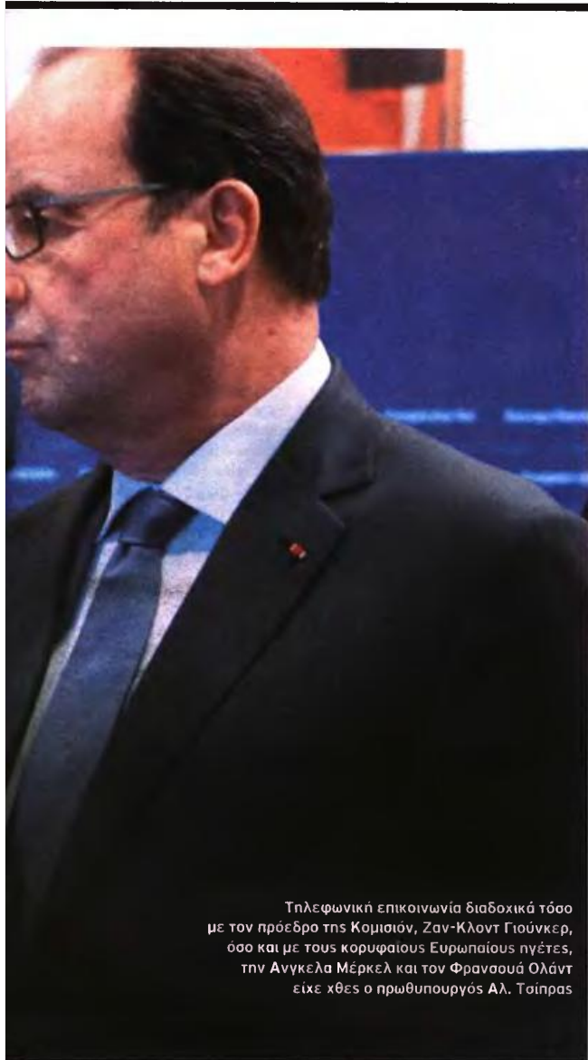
Τηλεφωνική επικοινωνία διαδοχικά τόσο με τον πρόεδρο της Κομισιόν, Ζαν-Κλοντ Γιούνκερ, όσο και με τους κορυφαίους Ευρωπαίους ηγέτες, την Ανγκελα Μέρκελ και τον Φρανσουά Ολάντ είχε χθες ο πρωθυπουργός Αλ. Τσίπρας