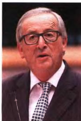
▲ Ο ΠΡΟΕΔΡΟΣ της Κομισιόν, Ζαν-Κλοντ Γιούνκερ

το θρίλερ μπορεί ενδεχομένως να συνεχιστεί και τα προσεχιά 24ωρα, χωρίς αυτό να σημαίνει ότι αποκλείεται πράξη συμφωνίας στο σημερινό Eurogroup και εκταμίευση της δόσης