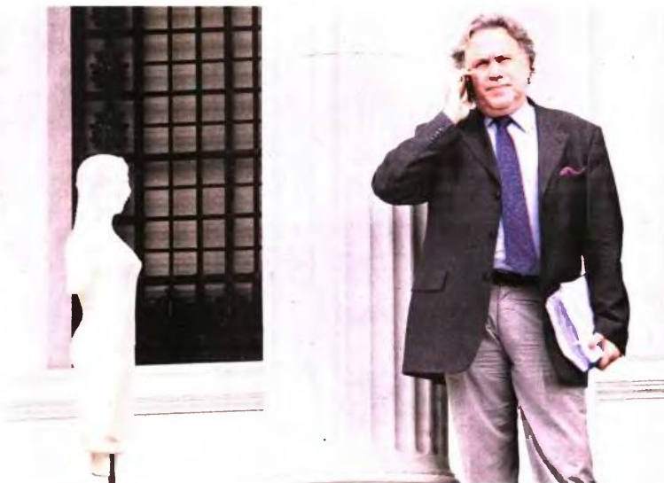
Ο υπουργός Εργασίας, Κοινωνικής Ασφάλισης και Κοινωνικής Αλληλεγγύης Γιώργος Κατρούγκαλος

Κάτι τέτοιο σημαίνει ότι, κατά πρώτον, θα πρέπει να μειωθούν οι καταβαλλόμενες επικουρικές συντάξεις κατά τουλάχιστον 15%... Πρέπει να σημειωθεί ότι το όποιο σενάριο έχει μελετηθεί έχει καταδείξει ότι για να βγουν με ισοσκελισμένους προϋπολογισμούς τα ταμεία επικουρικής ασφάλισης θα πρέπει εδώ και τώρα να μειώσουν