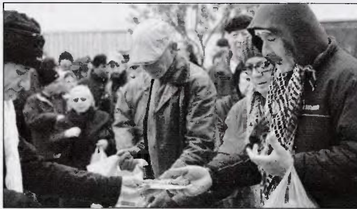
Όπως αναφέρει το δημοσίευμα «η οικονομική κρίση χτυπάει πιο δυνατά τους φτωχότερους και τους πιο αδύναμους»

Και συνεχίζει, κάνοντας έναν παραλληλισμό: «Καθώς η Αθήνα θυμίζει όλο και περισσότερο τη Σοβιετική Ένωση με ουρές ανθρώπων έξω από τις τράπεζες, περιμένοντας να πάρουν το ημερήσιο επιτρεπόμενο ποσό, κάποιες ομάδες βοήθειας βλέπουν τους προμηθευτές τους να μειώνονται. Και οι ουρές για τρόφιμα, ρούχα και φάρμακα έχουν αυξηθεί δραματικά τις τελευταίες ημέρες. Φυσικά, δεν είναι όλη η Αθήνα έτσι. Στο κέντρο της πόλης και στα πιο εύπορα προάστια, οι καφετέριες είναι γεμάτες από Έλληνες και τουρίστες που τρώνε και διασκε-