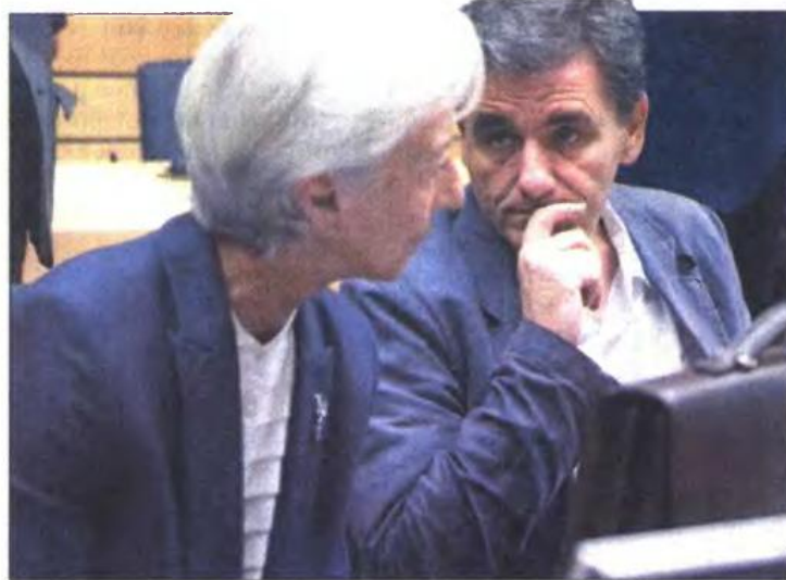
Ο Ευκλ. Τσακαλώτος με την Κριστίν Λαγκάκντ στις Βρυξέλλες

ποινή αυτή είναι στο 6%). Επίσης, θα υπάρχουν ξεχωριστές διατάξεις για τον καθορισμό των εργαζομένων που θα επιβαρύνονται, για να εξακριβωθεί πλήρως εάν προστατεύονται όσοι έχουν θεμελιωμένα συνταξιοδοτικά δικαιώματα και τελικά ποιες είναι οι κατηγορίες που πλήττονται. Πάντως, με βάση τα συμφωνηθέντα, πρέπει να εξαιρεθούν από τις παραπάνω παρεμβάσεις μόνο όσοι εργάζονται σε επαγγέλματα για τα οποία καταβάλλονται Βαρέα και Ανθυγιεινά Ενσημα (ΒΑΕ) αλλά και οι μπότερες τέκνων με αναπηρία. • Σταδιακή κατάργηση του ΕΚΑΣ για όλους έως το τέλος του 2019. Υπάρχει, όμως, η δέσμευση ότι το 20% των «προνομιούχων» δι-