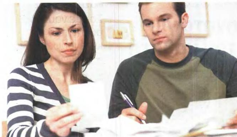
▲ Η ΠΛΕΙΟΝΟΤΗΤΑ των οφειλετών στην Εφορία χρωστά ποσά έως 5.000 ευρώ

Μέχρι τα τέλη Ιουνίου αναμένεται να παραταθεί η ρύθμιση. »15