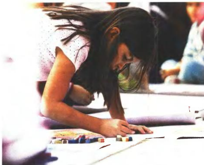
Σύμφωνα με την αρμόδια διεύθυνση Εκπαίδευσης και Αθλητισμού του κεντρικού δήμου το πρόγραμμα λειτουργεί, όταν τα σχολεία είναι κλειστά και συγκεκριμένα από την 1η Ιουλίου ως την 31η Αυγούστου.

Σύμφωνα με τον προγραμματισμό της αρμόδιας διεύθυνσης Εκπαίδευσης και Αθλητισμού του δήμου Θεσσαλονίκης το πρόγραμμα δημιουργικής απασχόλησης