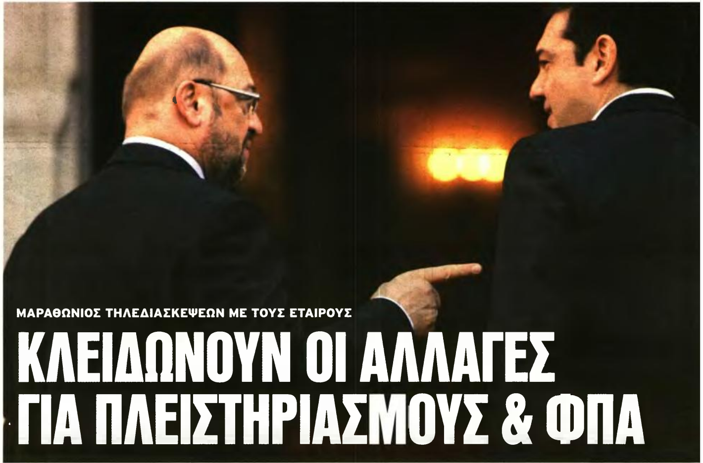
ΜΑΡΑΘΩΝΙΟΣ ΤΗΛΕΔΙΑΣΚΕΨΕΩΝ ΜΕ ΤΟΥΣ ΕΤΑΙΡΟΥΣ