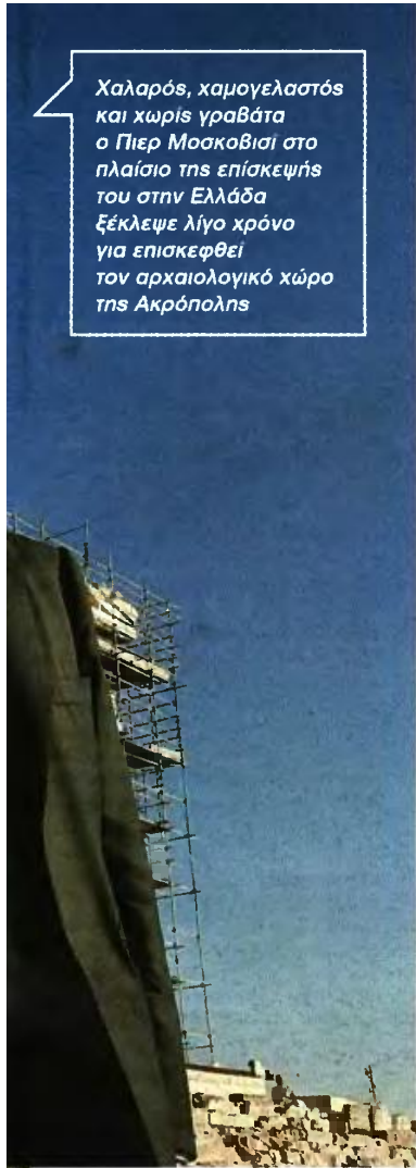
ΕΥΡΩΝΙΣΣΙ ΕΤΡ/ΟΣ ΜΕΙΝΑΕ

Χαλαρός, χαμογελαστός και χωρίς γραβάτα ο Πιερ Μοσκόβισι στο πλαίσιο της επίσκεψής του στην Ελλάδα ξέκλειψε λίγο χρόνο για επισκεφθεί τον αρχαιολογικό χώρο της Ακρόπολης