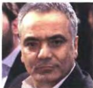
Πάνος Σκουρλέτης, υπουργός Εργασίας.

Όπως ειδικότερα αναφέρεται, για την ασφάλιση, περίθαλψη,