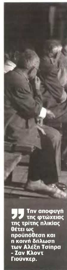
Την αποφυγή της φτώχειας της τρίτης ηλικίας θέτει ως προϋπόθεση και η κοινή δήλωση των Αλέξη Τσίπρα - Ζαν Κλοντ Γιούνκερ.

▼ Η φράση περί «αποφυγής της φτώχειας της τρίτης ηλικίας», όπως αποτυπώθηκε στην κοινή ανακοίνωση των Αλέξη Τσίπρα και Ζαν Κλοντ Γιούνκερ, θα μπορούσε να χαρακτηριστεί, από ορισμένους υπέρμαχους του άλλοτε σφρηγηλού κράτους πρόνοιας, ακόμη και ως «συμβολιακού χαρακτήρα» τοποθέτηση του Έλληνα πρωθυπουργού και του προέδρου της Κομισιόν, για τη διαμόρφωση των όρων ενός βιώσιμου ασφαλιστικού συστήματος, όχι μόνο για την παρούσα συνταξιακή αιχμή αλλά και για τη συνολική αναμόρφωση του τομέα υγείας και πρόνοιας στη χώρα μας. Η σχετική βιβλιογραφία για το «κράτος πρόνοιας» και το μεταπολεμικό «κοινωνικό συμβόλαιο εργασίας - κεφαλαίου» στις χώρες της Ευρώπης είναι... αχανής! Πού βρισκόμαστε σήμερα; Οι εκπρόσωποι των θεσμών θεωρούν, φερόμενοι, τα κονδύλια για τις πληρωμές των συντάξεων ως κόστος του κρατικού προϋπολογισμού. Αυτός είναι ο κυρίαρχος λόγος που μέχρι πρότινος επέμεναν σε νέες δραστηριότητες περικοπές όχι μόνο των εργαζομένων αλλά και των κύριων συντάξεων. Στο θέμα αυτό φαίνεται πως υπάρχουν δεύτερες σκέψεις, που ενδεχομένως μπορεί να οδηγήσουν σε μια υπαναχώρηση, από πλευράς δανειστών, τουλάχιστον σε ό,τι αφορά τις χαμηλές συντάξεις, έως 700 ευρώ. Επίσης, υπάρχουν πιέσεις για εφαρμογή της ρήτρας μηδενικού ελλείμματος στα επικουρικά ταμεία, καθώς και στα ταμεία πρόνοιας. Σύμφωνα με ασφαλείς πληροφορίες της «N», το υπουργείο Εργασίας και Κοινωνικής Ασφάλισης δεν είναι διατεθειμένο να υποχωρήσει στο θέμα της κατάργησης της ρήτρας μηδενικού ελλείμματος.