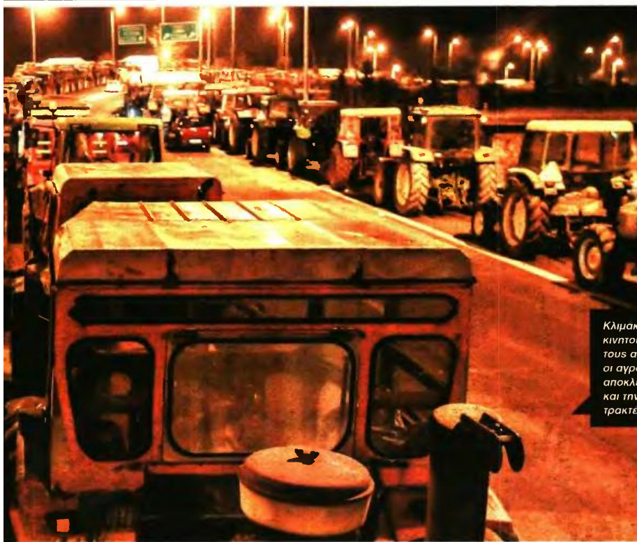
Κλιμακώση των κινητοποιήσεων αποφάσισαν οι αγρότες, ενώ δεν αποκλείουν ακόμη και την καθόδο των τρακτέρ στην Αθήνα