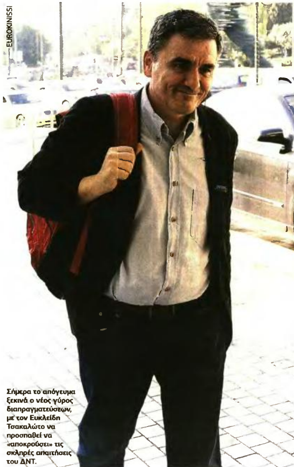
Σήμερα το απόγευμα ξεκινά ο νέος γύρος διαπραγματεύσεων, με τον Ευκλείδη Τσακαλώτο να προσπαθεί να «αποκρούσει» τις σκληρές απαιτήσεις του ΔΝΤ.

Επίσης, διαπιστώνουν μεγάλο κενό στην προετοιμασία του φορο-