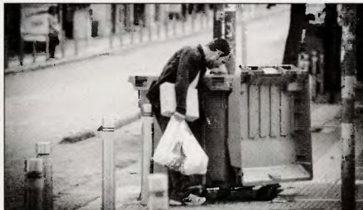
Σε απόλυτους αριθμούς, 3.885.000 άνθρωποι στην Ελλάδα βρίσκονται σε κίνδυνο φτώχειας ή στερούνται υλικών αγαθών ή ζουν σε νοικοκυριά με χαμηλή ένταση εργασίας

Σύμφωνα με την έκθεση: Ποσοστό 42,7% του πληθυσμού βρίσκεται σε κίνδυνο φτώχειας με το εισόδημά του να είναι χαμηλότερο από το κατώφλι της φτώχειας. Στην έναρξη της οικονομικής κρίσης, το 2009 το ποσοστό αυτό ήταν μόλις