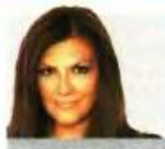
ΤΗΣ ΒΟΥΛΑΣ ΚΕΧΑΓΙΑ

που θα παρουσιάσει στους τρώικανούς για την αναδιάρθρωση του φόρου εισοδήματος, «που θα έχει στόχο να αμβλύνουμε τις κοινωνικές ανισότητες» εξηγεί στα «ΝΕΑ» αρμόδια πηγή. Ουσιαστικά το Μαξίμου θα επικριθεί να εξισορροπήσει τη νέα κατάσταση που διαμορφώνει το Ασφαλιστικό εις βάρος όσων πλύνονται από τις νέες ρυθμίσεις αλλάζοντας φορολογικούς συντελεστές για χαμηλά εισοδήματα προς τα κάτω.