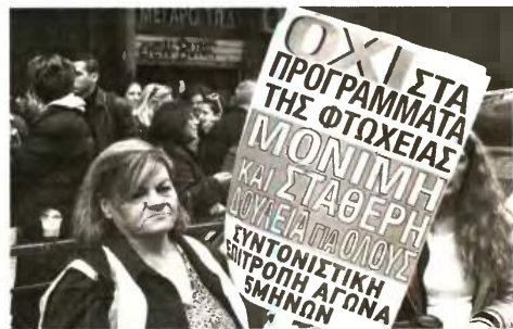
Απο την κινητοποίηση που εκαναν κτες στο υπουργείο Εργασίας οι εργαζόμενοι στα «πεντάμηνα»

● Η θέσπιση της λειτουργίας του Γενικού Νοσοκομείου Σαντορίνης υπό την Ανώνυμη Εταιρεία Μονάδων Υγείας ΑΕ γίνεται με τέτοιο τρόπο που καμιά σχέση δεν έχει με την απαίτηση για δημόσια δωρεάν Υγεία για τους κατοίκους του νησιού και για την εξασφάλιση των δικαιωμάτων των εργαζομένων σε αυτό. Το νοσοκομείο που φτιάχτηκε με χρήματα του ελληνικού λαού και παρέμεινε κλειστό για χρόνια, αυτή η λειτουργήσι με αποκλειστική χρηματοδότηση από το κράτος για να προσφέρει δωρεάν τις υπηρεσίες του στους κατοίκους της Σαντορίνης και των γύρω νησιών, θα λειτουργεί με καθαρά ιδιωτικοοικονομικά κριτήρια. Ενδεικτικά, η ΑΕΜΥ ΑΕ θα μπορεί να προσλαμβάνει προσωπικό με συμβάσεις ορισμένου χρόνου που θα πληρώνεται από την ΑΕ. Θα μπορεί να αποσπάσει προσωπικό από τα νοσοκομεία του ΕΣΥ, αλλά η πληρωμή των εφημε-