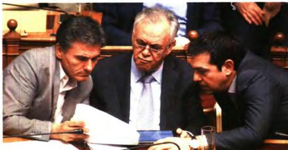
Ο ΠΡΩΘΥΠΟΥΡΓΟΣ ΑΛ. ΤΣΙΠΡΑΣ με τον αντιπρόεδρο της κυβέρνησης Γ. Δραγασάκη και τον υπουργό Οικονομικών Ευκλ. Τσακαλώτο στη Βουλή