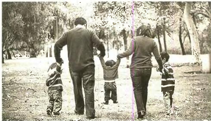
Όλες οι παράμετροι που συνδέονται με το δημογραφικό πρόβλημα (όροι ζωής, υπογεννητικότητα, μετανάστευση, θνησιμότητα κ.λπ.), είναι πρωτίστως πολιτικο - κοινωνικοί, σημειώνει το ΚΚΕ

Μ ε επιστολή της προς όλα τα κόμματα, ενόψει των βουλευτικών εκλογών, η Ανώτατη Συνομοσπονδία Πολυτέκνων Ελλάδας (ΑΣΠΕ) ζήτησε να πληροφορηθεί τις θέσεις τους για το δημογραφικό και τα προβλήματα της πολύτεκνης οικογένειας. Ο ΓΓ της ΚΕ του ΚΚΕ, Δημήτρης Κουτσούμπα, έστειλε στην ΑΣΠΕ την παρακάτω απαντητική επιστολή: