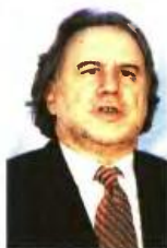
Οι δανειστές ετοιμάζουν δική τους πρόταση για το ασφαλιστικό και προχωρούν άρθρο προς άρθρο σε τροποποιήσεις του σχεδίου Κατρούγκαλου.