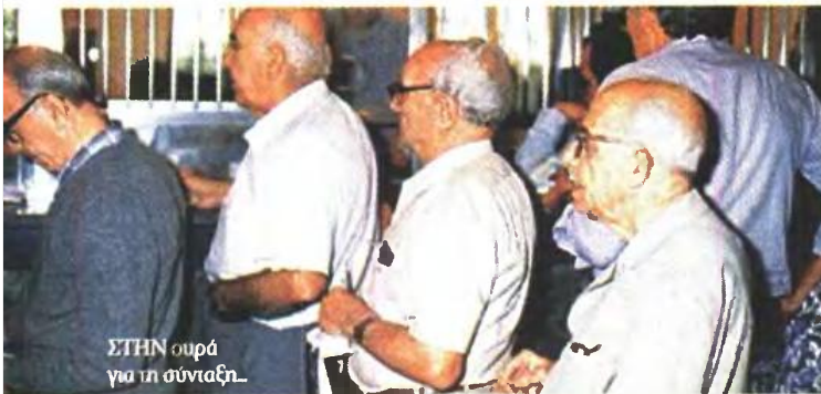
ΣΤΗΝ ουρά για τη σύνταξη...

-Στα Ταμεία Πρόνοιας που χορηγούν τα εφάπαξ η λίστα αναμονής απαριθμεί 50.000 ασφαλισμένους, με αποχώρηση μετά την 1η/9/2013. Οι 41.000 προέρχονται από το Δημόσιο, τους ΟΤΑ και τους επο-